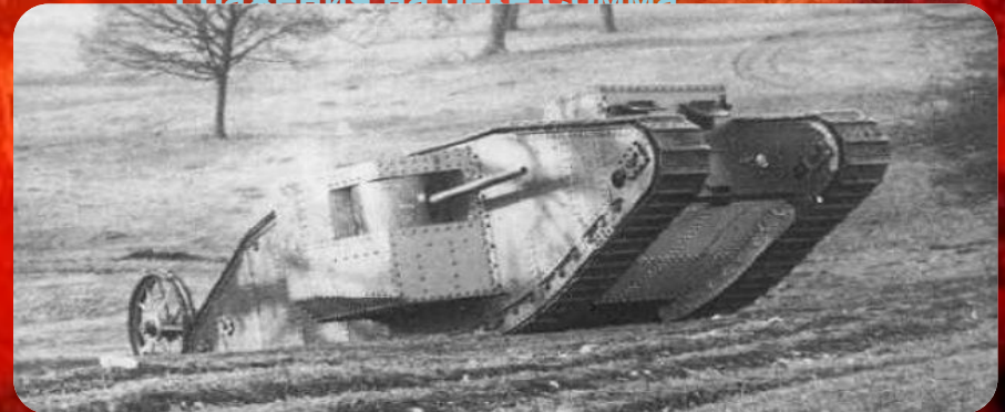
В сражении у реки Сомма участвовали 32 английских танка Mk 1.