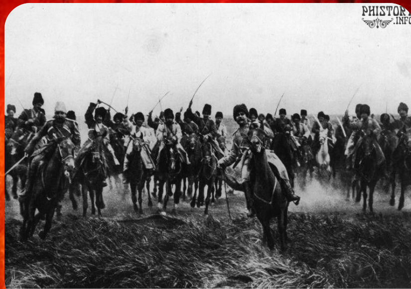
Атака русской кавалерии в битве при Танненберге. 26 августа 1914 года.

Это крупномасштабное сражение между русскими и немецкими войсками произошло в период с 17 августа по 2 сентября 1914 г. в ходе Восточно-Прусской операции. В сражении участвовали 1-я и 2-я русская армии общей численностью в 250 тыс. чел и 8-я германская армия численностью 200 тыс. чел. Русскими войсками командовал генерал А.В. Самсонов. В ходе боев русские войска из-за несогласованности, были разбиты противником по частям и отброшены назад. Итогом Танненбергской битвы стали общие потери русской армии в 150-200 тысяч человек, потери германских войск составили около 50 тысяч человек. Поражение русских войск позволило германским войскам перебросить позже подкрепления на Западный фронт, но наступление русских войск не дало 8-й армии Германии оказать помощь австро-венгерским силам в Галицийской битве, что повлекло в дальнейшем поражение австро-венгерских войск.