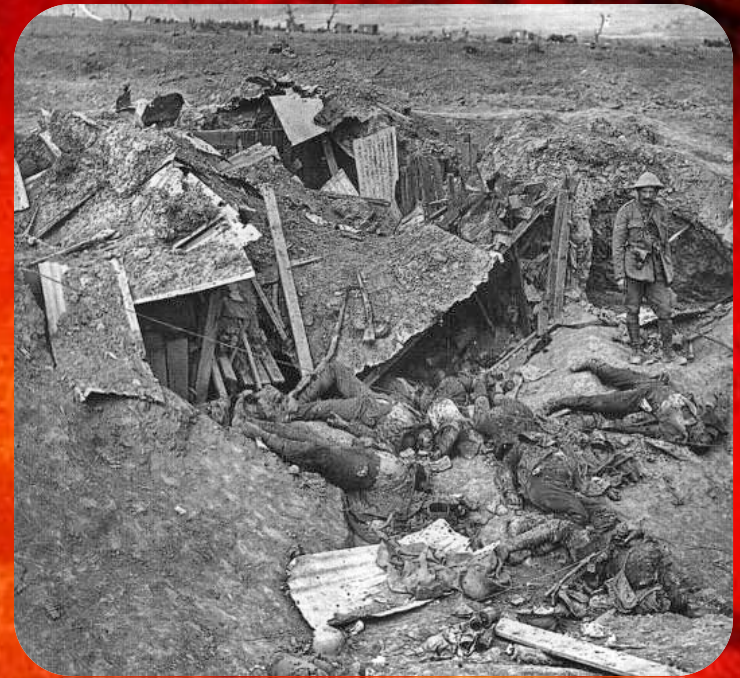
1916 год - начало сражения на реке Сомма

Наступление француско-британских армий было запланировано на межсоюзнической конференции в Шантийи в декабре 1915 года. Наступление планировалась как тяжелое и длительное сражение с методическим прорывом германской обороны путем последовательного захвата одного рубежа за другим по принципу артиллерия опустошает, пехота наводняет», фронт прорыва немецких позиций составлял 40-70 км. Операция проходила по обеим сторонам реки Сомма с 1 июля по 18 ноября 1916 года. Основную роль в наступлении на Сомме играла французская армия, на северном фланге её поддерживала 4-я армия Британского экспедиционного корпуса. В этой операции Франции не удалось достичь желаемого результата, за 4 месяца боев и потери более полумиллиона человек союзнические войска смогли продвинуться лишь на 12 км но темни менее битва на реке Сомма показала превосходство Антанты. Это сражение знаменательно так же тем, что в нем впервые использовалась такая боевая единица как танки, хотя из-за своей отсталость они не смогли достаточным образом проявить себя