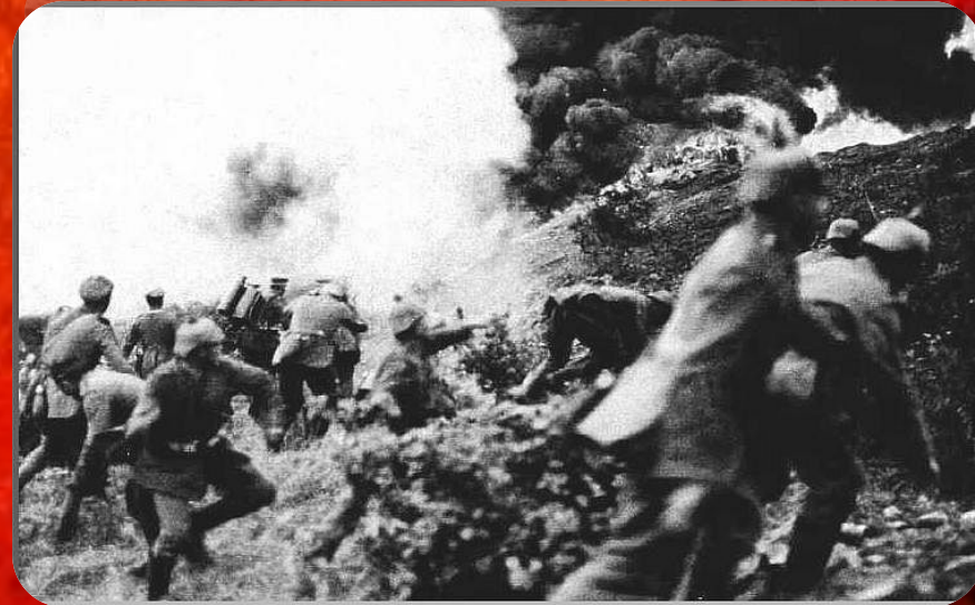
Верденская битва. 15 марта. 1916.