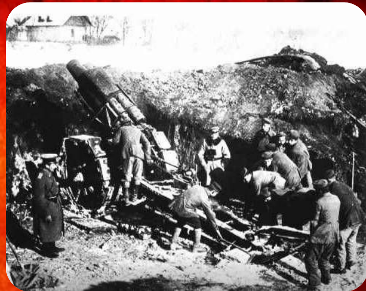
Российская артиллерия 1916 год.

Наступательная операция русских войск Западного и Северного фронтов, проходившая в период с 5 по 17 марта 1916 года в районе озера Нарочь. Проводилась по просьбе союзников в связи с их тяжёлым положением под Верденом с целью разгромить 8-ю и 10-ю германские армии и отвлечь возможно больше германских войск с Западного фронта. Замысел операции состоял в нанесении главных ударов в двух направлениях - 5-й армией Северного фронта из района северного Двинска и 2-й армией Западного фронта севернее и южнее озера Нарочь. Из-за несогласованности действий русских войск, слабо проведенной артиллерийской подготовки в связи с нехваткой боеприпасов, а так же начавшейся весенней распутицей русским войскам не удалось прорвать оборону германской армии, продавив ее лишь на глубину от 2 до 8 километров. В ходе боев русские войска понесли большие потери так и не добившись существенных результатов. Несмотря на неудачно прошедшую Нарочскую операцию, русским войскам удалось сковать значительные силы германских войск, вынудив их прекратить на две недели атаки на Западном фронте в районе города Верден, позволив союзникам восстановить свои силы.