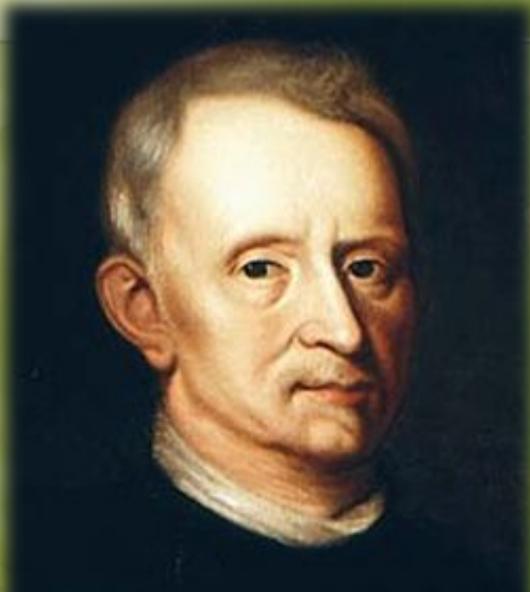
Роберт Гук (1635-1703гг)