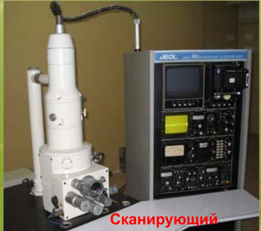
Сканирующий электронный микроскоп.