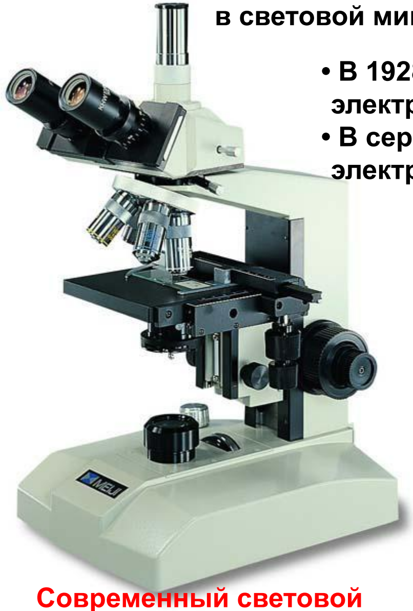
Современный световой микроскоп.