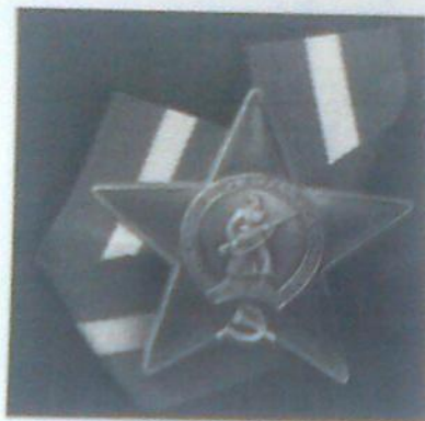
Орден «Красная Звезда».