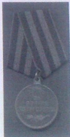
Медаль « За взятие Кенигсберга »