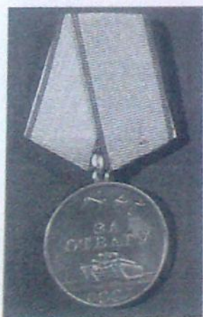
Медаль « За отвагу »