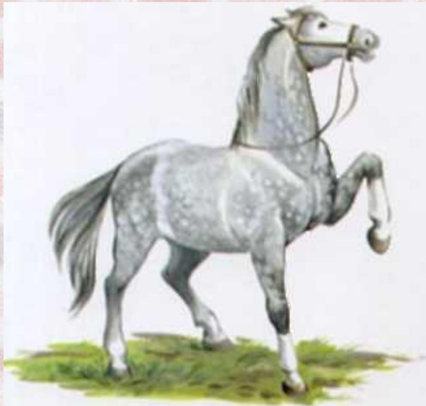
Конь бьет копытами