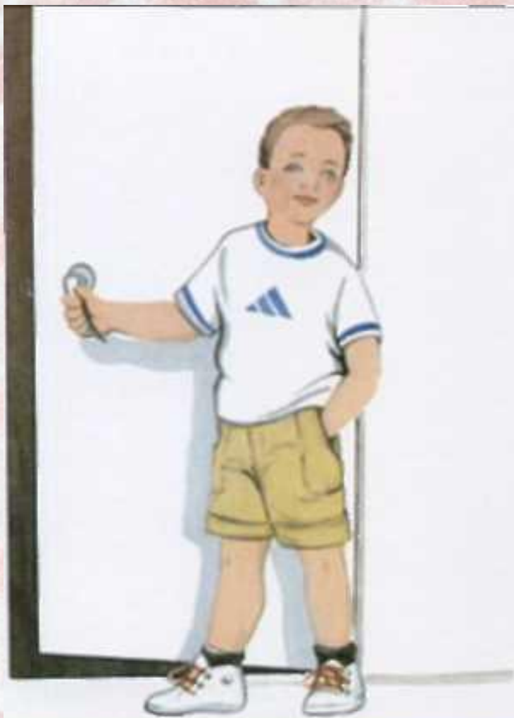
Мальчик хлопает дверью