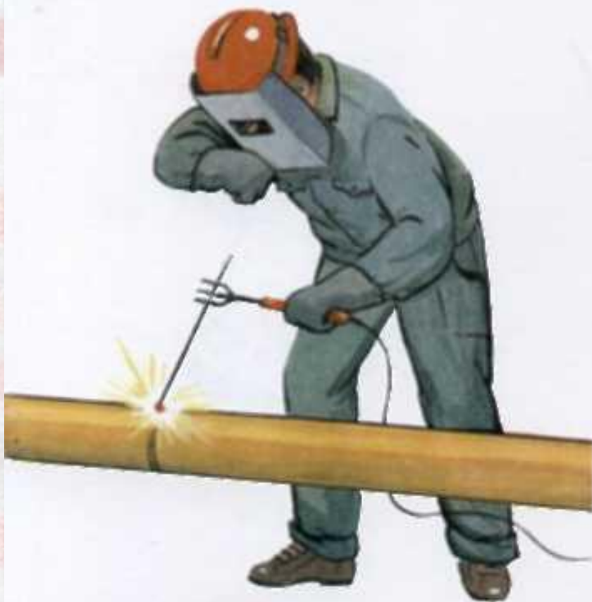
Сварщик варит трубопровод