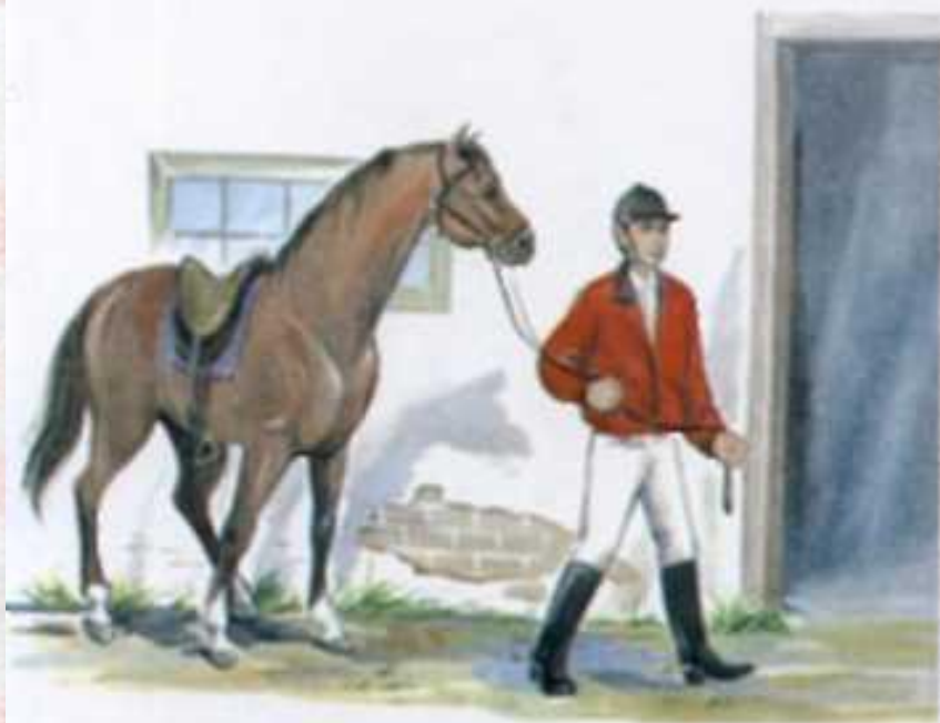
Всадник заводит коня в конюшню