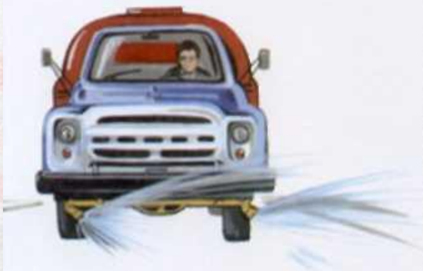
Машина поливает улицу