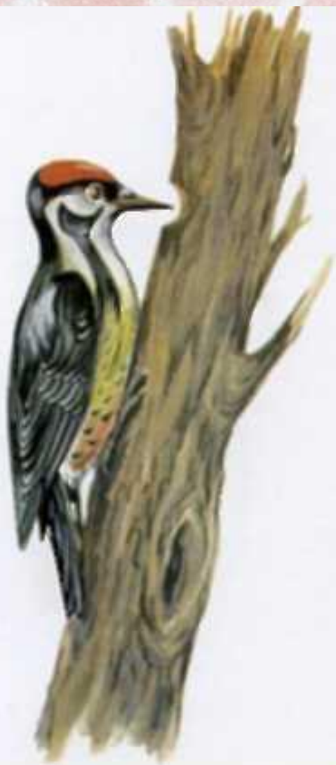
Дятел стучит по стволу дерева