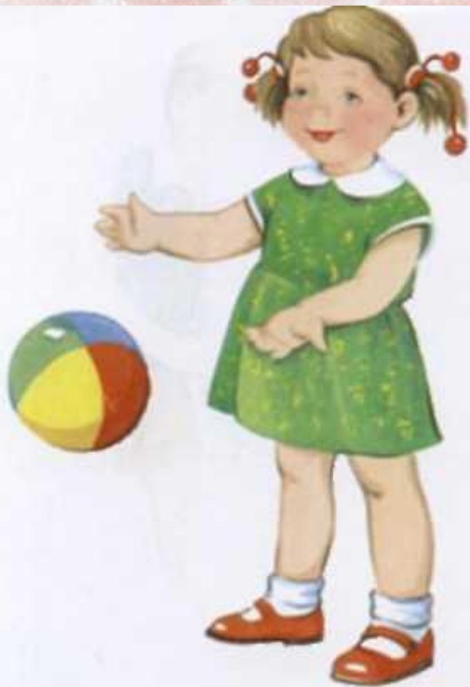
Девочка ловит мяч