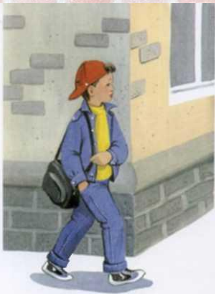
Мальчик заворачивает за угол