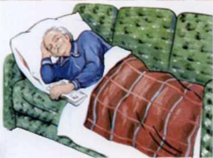
Дедушка лежит на диване