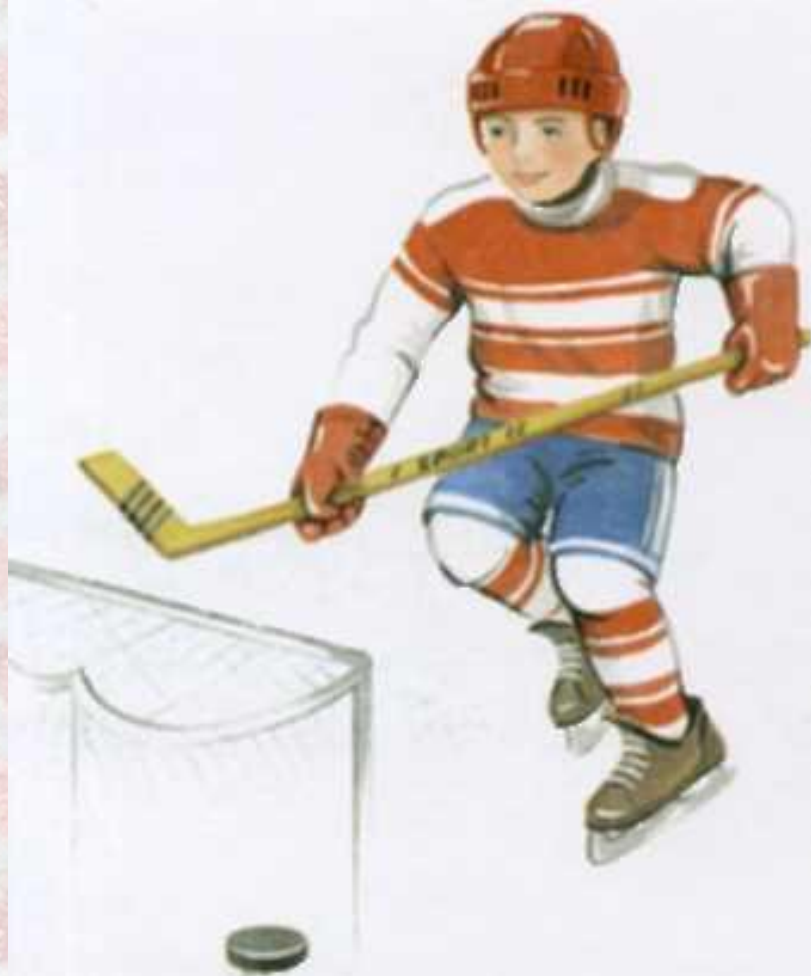
Хоккеист забивает шайбу