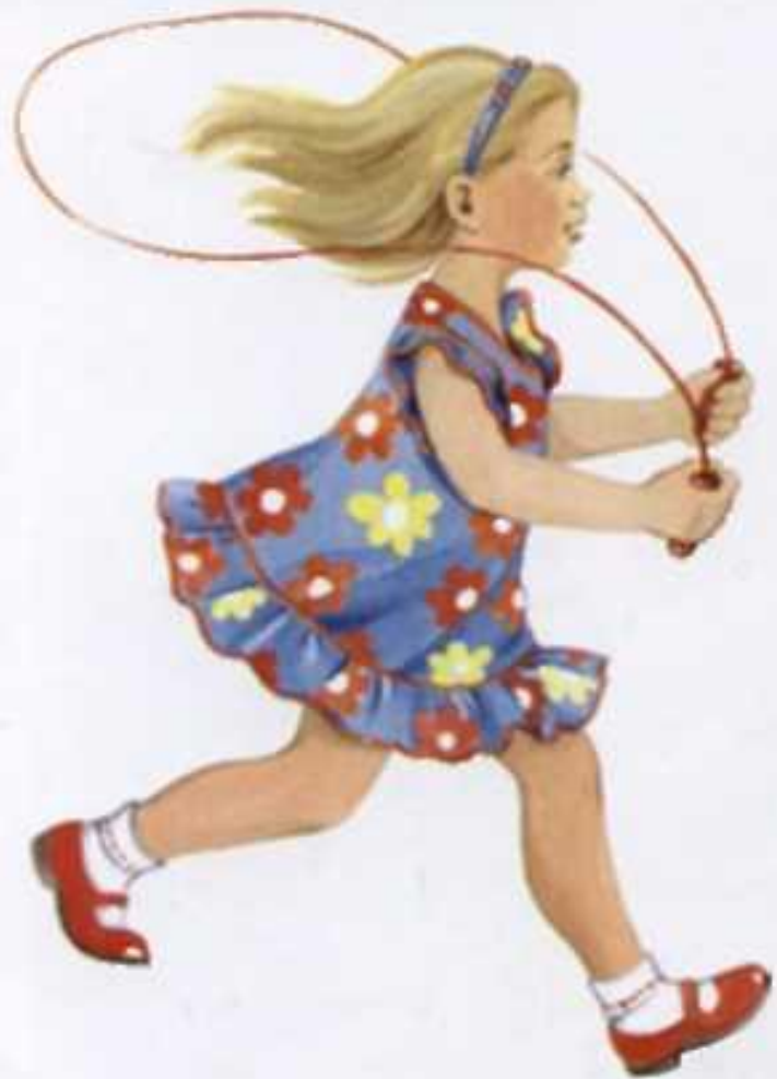
Девочка скачет со скакалкой