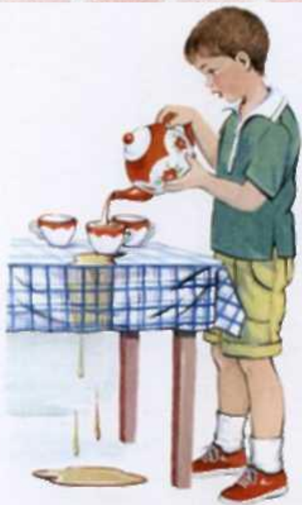
Мальчик переливает чай через край чашки