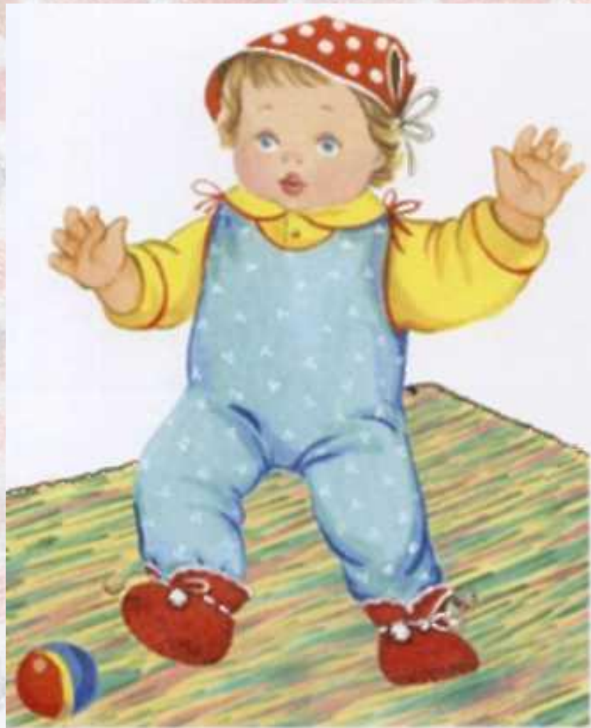
Малыш топает по ковру