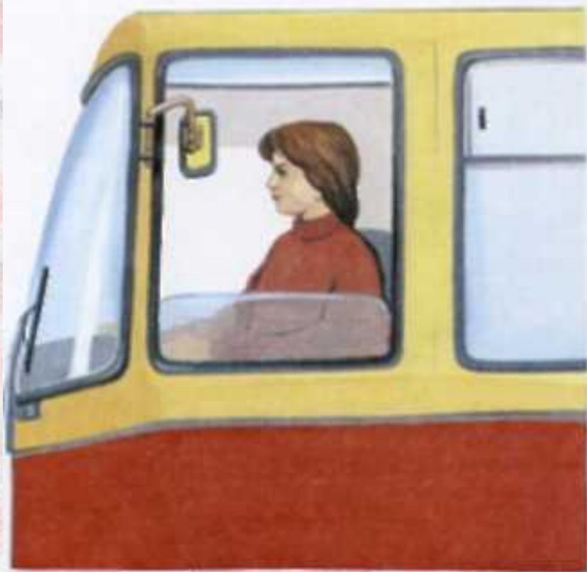
Водитель ведет трамвай