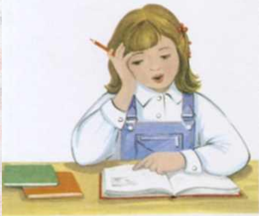
Ученица учит уроки