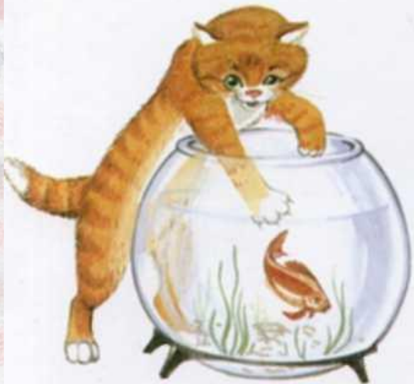
Кот лезет лапой в аквариум