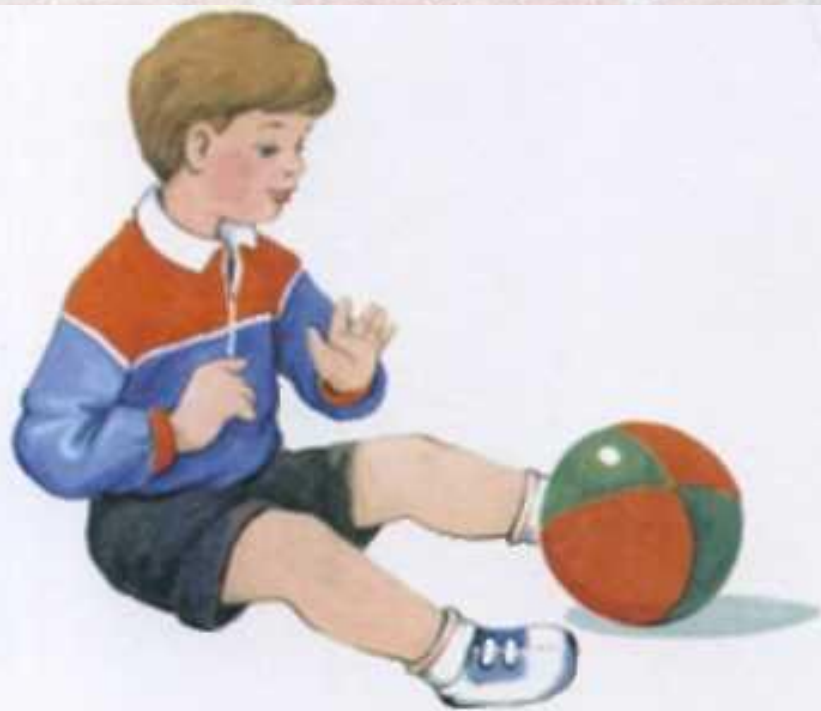
Мальчик катает мяч