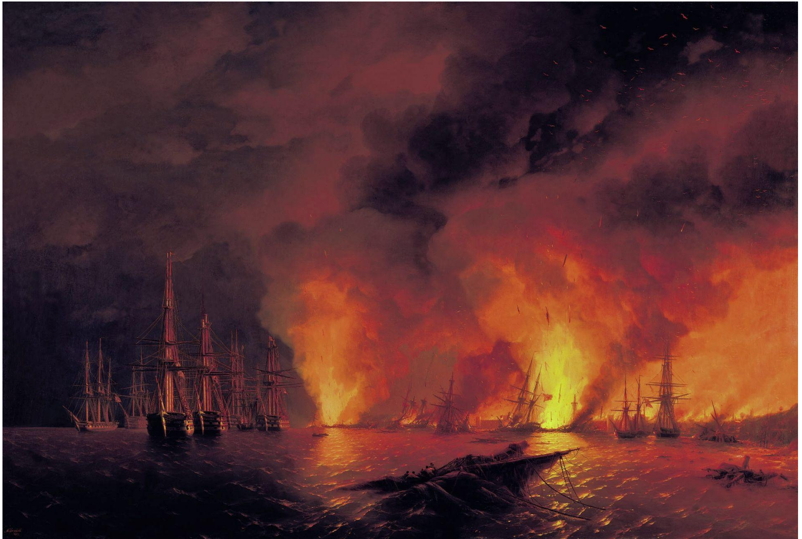
И. К. Айвазовский. «Синоп. Ночь после боя 18 ноября 1853 года».

Разгром турецкой эскадры в Синопском сражении значительно ослабил морские силы Турции и сорвал ее планы по высадке своих войск на побережье Кавказа.