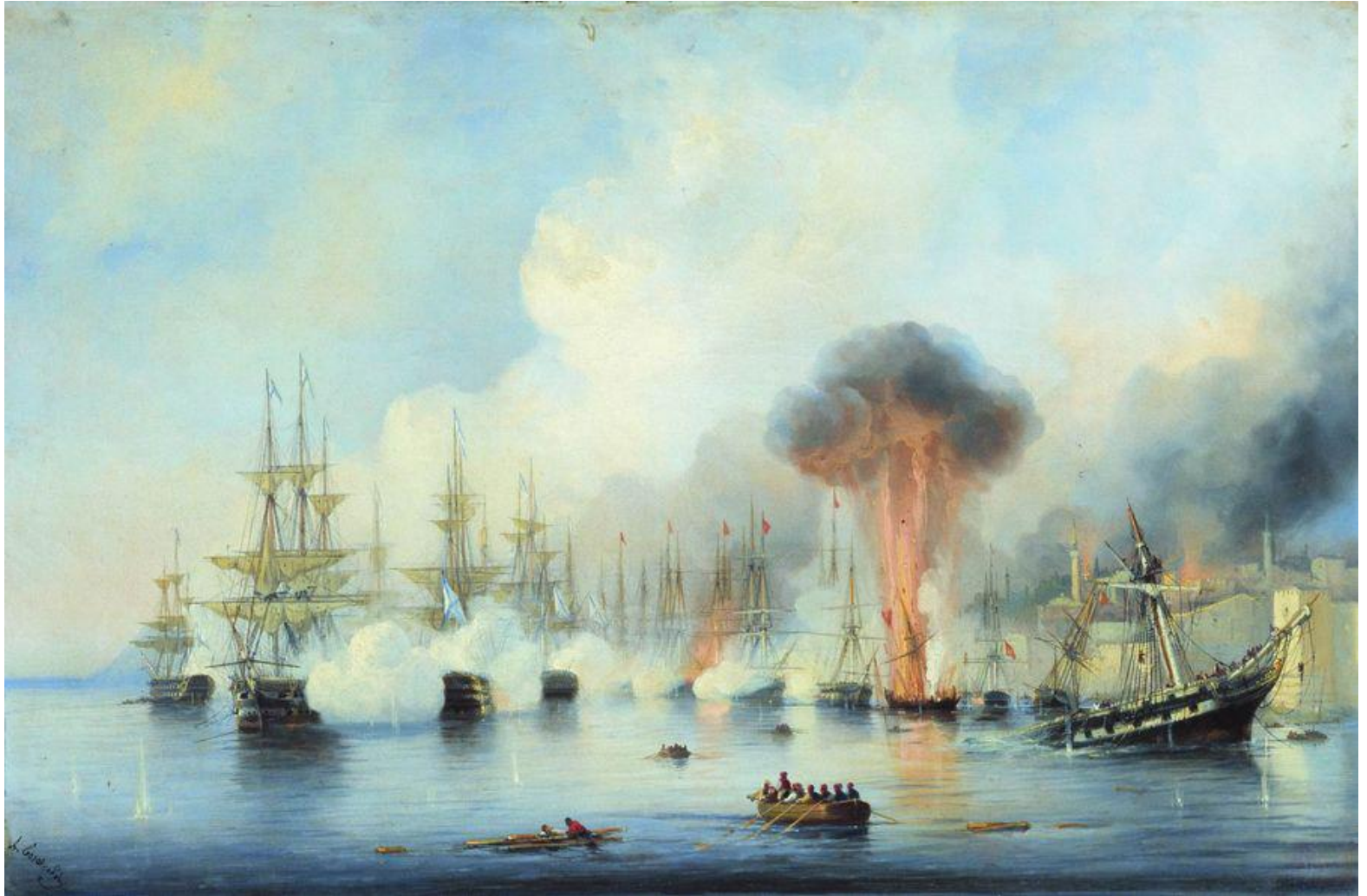
А. П. Боголюбов. «Синопский бой 18 ноября 1853 года».

В этом сражении турки потеряли 15 из 16 кораблей и свыше 3 тысяч человек убитыми и ранеными. В плен было взято около 200 человек, в том числе сам Осман-Паша и командиры трех кораблей.