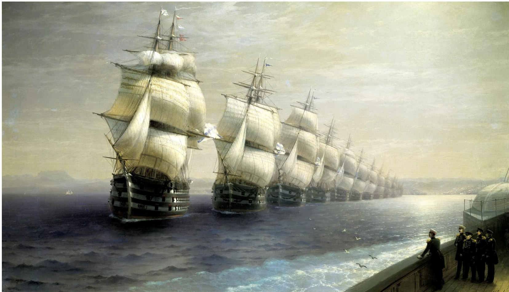
И. К. Айвазовский. «Смотр Черноморского флота в 1849 году».

Синопское морское сражение стало последним в истории крупным сражением эпохи парусного флота. На смену парусникам стали приходить корабли с паровыми двигателями.