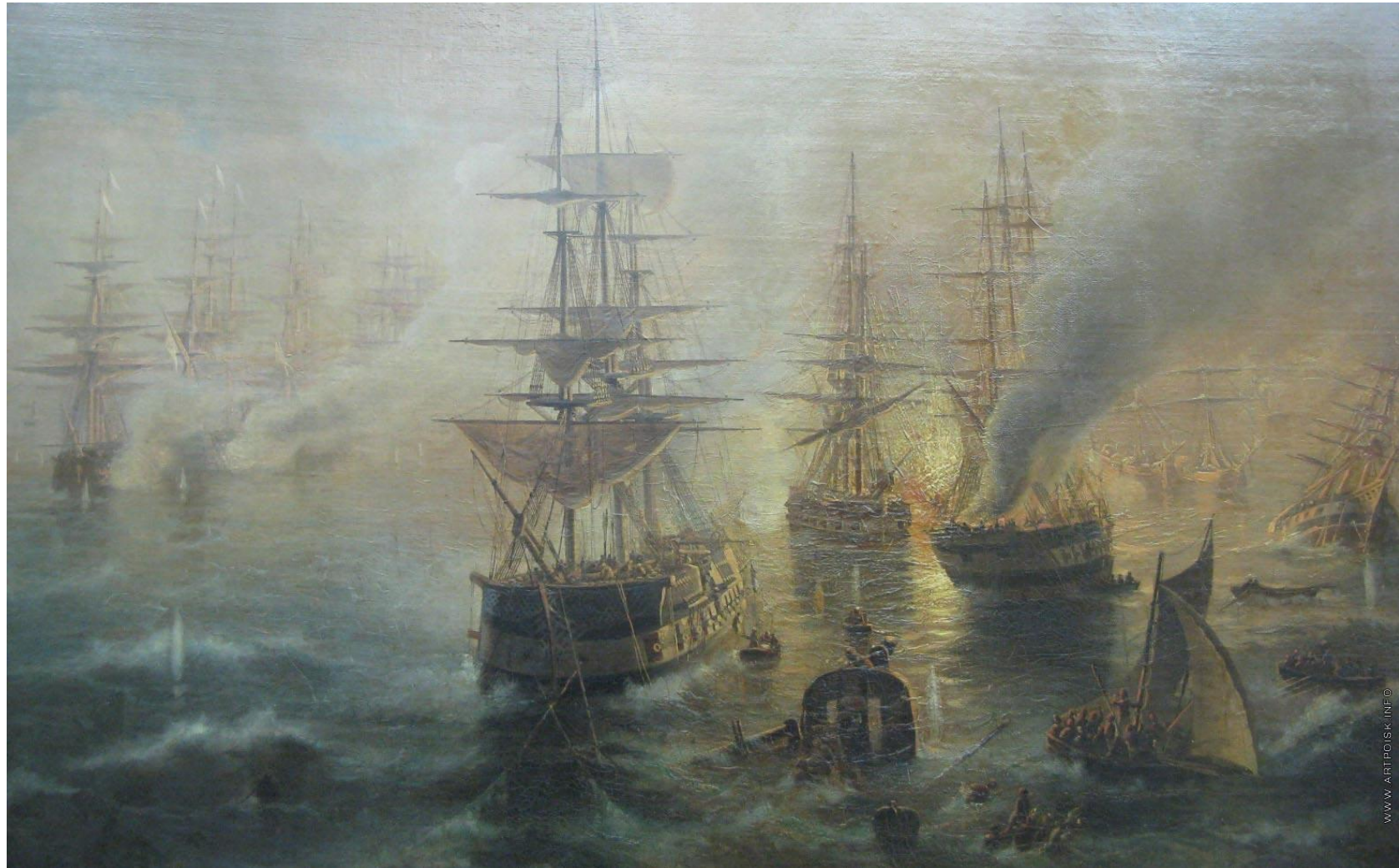
Жуковский Р. К. «Синопский бой в 1853 году».

Синопское морское сражение началось 18(30) ноября 1853 года в 12 часов 30 минут и продолжалось до 17 часов.