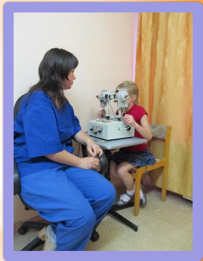
ОРТОПТИЧЕСКИЙ КАБИНЕТ, ЛЕЧЕНИЕ НА АППАРАТАХ