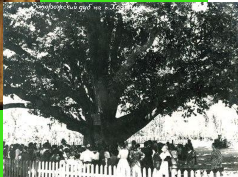
50-е года. Запорожский дуб.