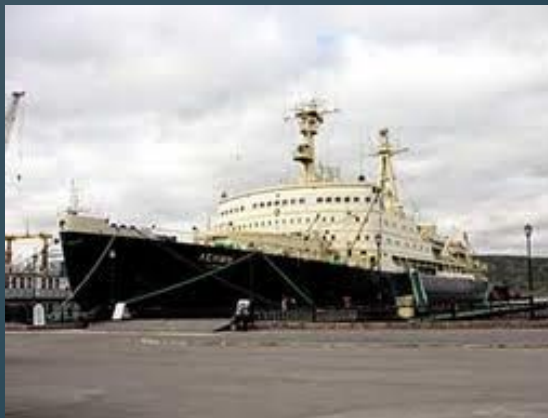
ядерные энергетические установки на транспорте.