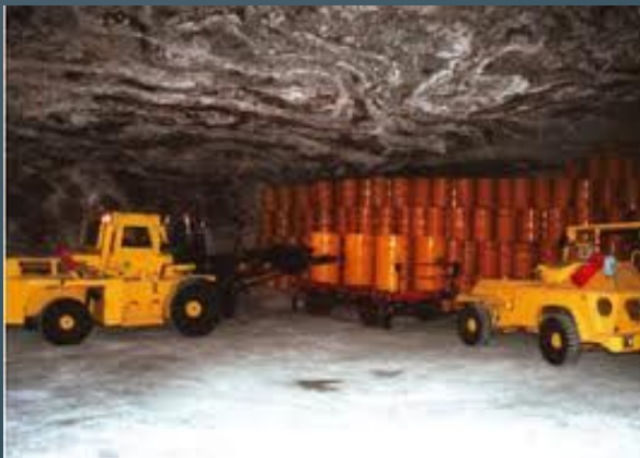
предприятия по захоронению радиоактивных отходов