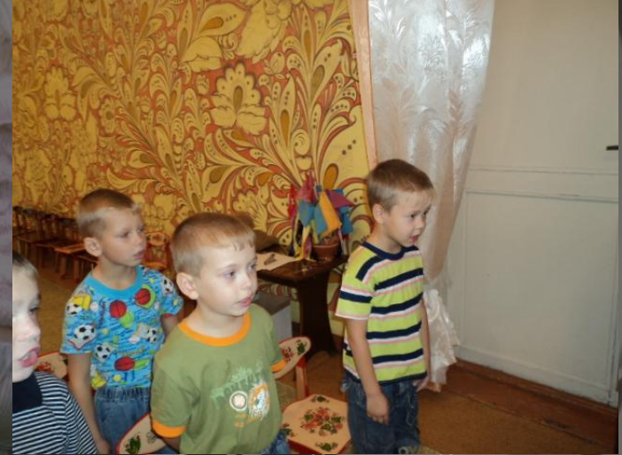
«Слушай и пой»