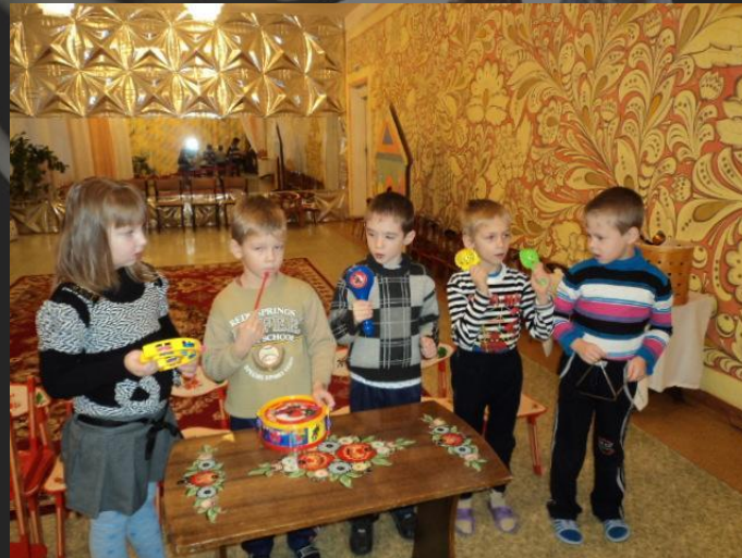
«Послушай и подыграй»