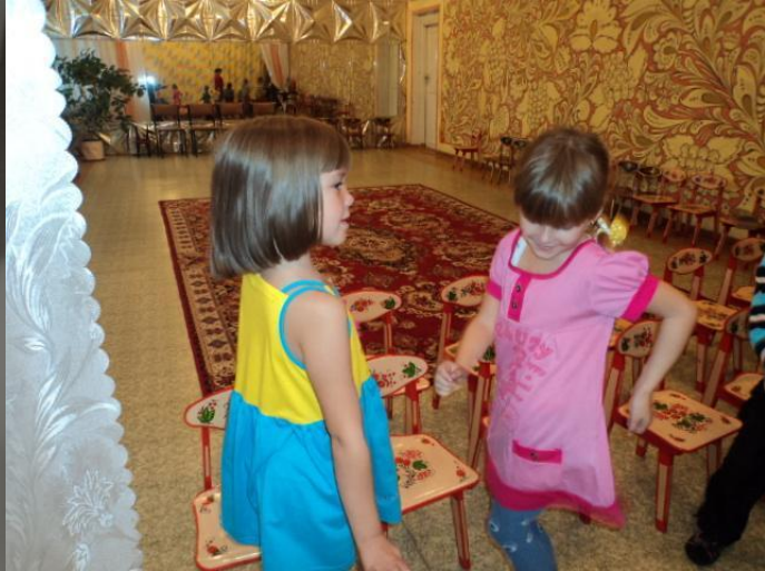
«Послушай и протанцуй»

1. Восприятие музыки – ведущий вид деятельности, потому что с первых минут жизни каждый человек обладает чувствами, эмоциями, восприятием окружающего.