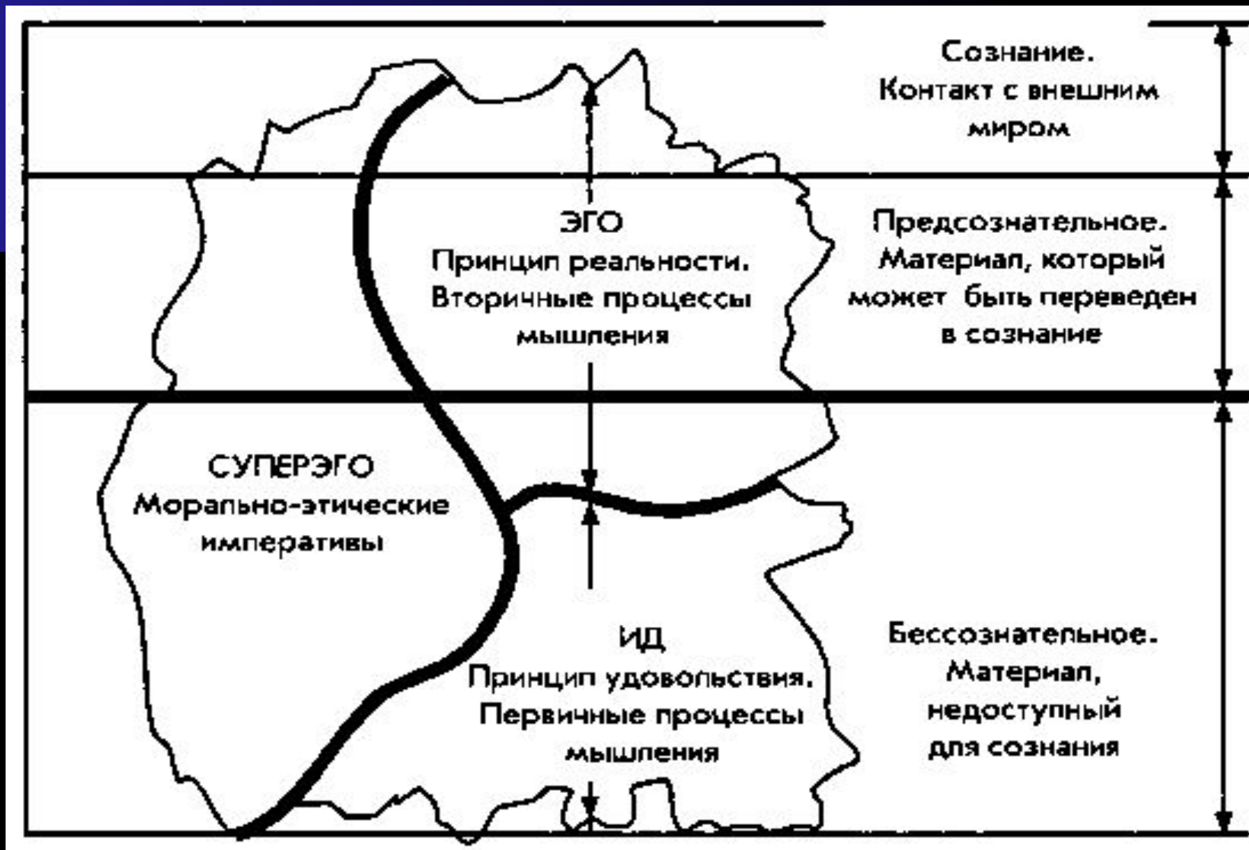
Рис. 1. Связь структурной модели с уровнями сознания.