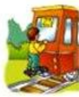
Катается сзади поезда