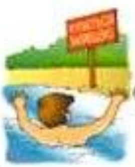
Купаются в запрещённом месте