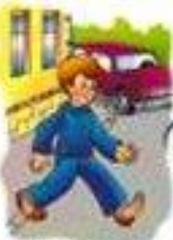
Пешеходный переход и переходный период