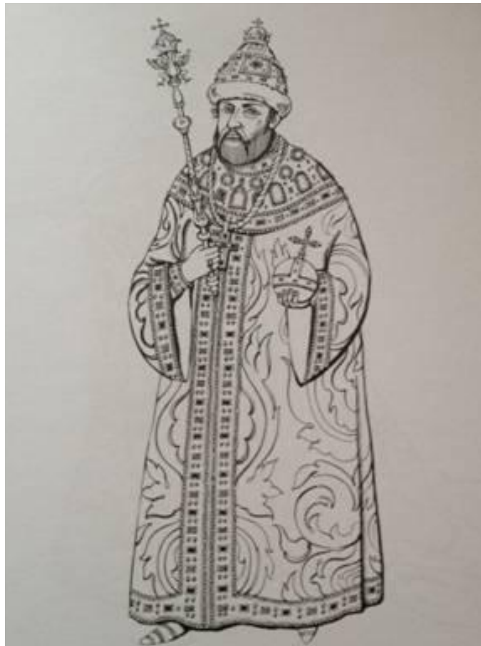
Алексей Михайлович (1629–1676), на престо-

лотых и серебряных нитях. Заглавная пико- нейшая ткань стоила очень дорого, из ней и