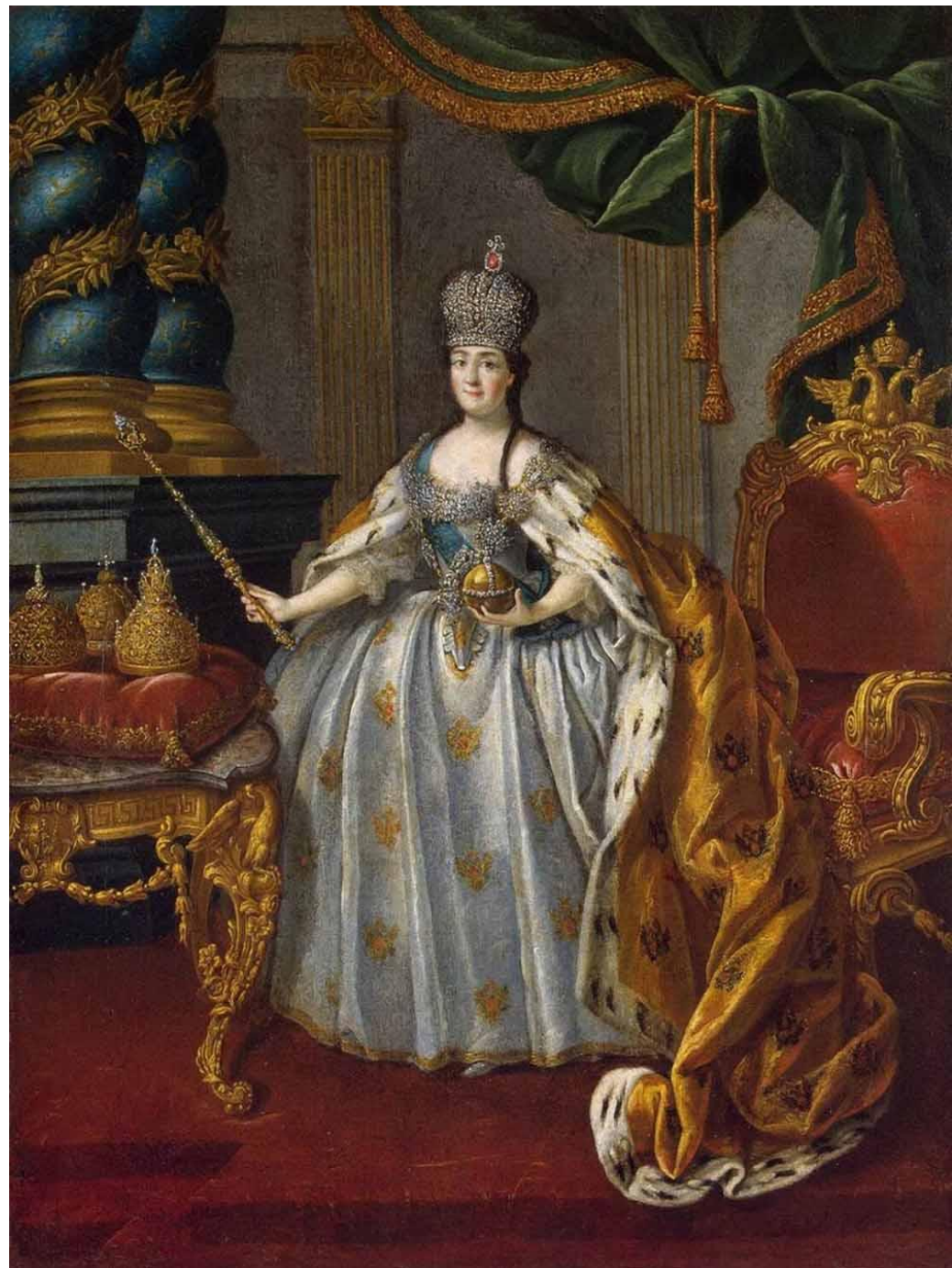
Антропов Алексей Петрович. «Портрет Екатерины II»