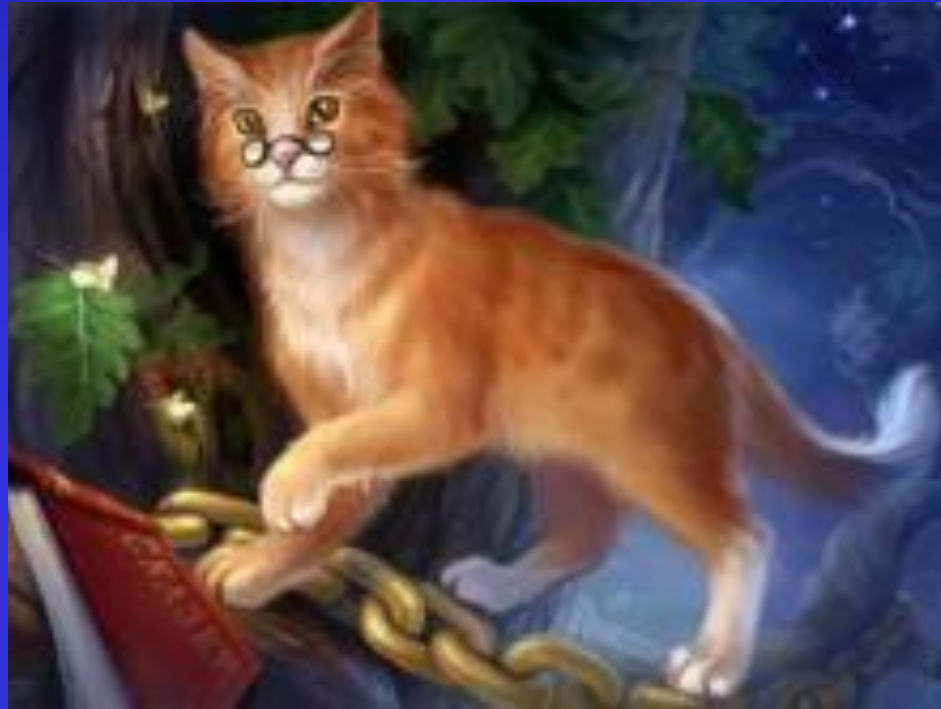
Кот ученый. (А.С.Пушкин «Руслан и Людмила»)