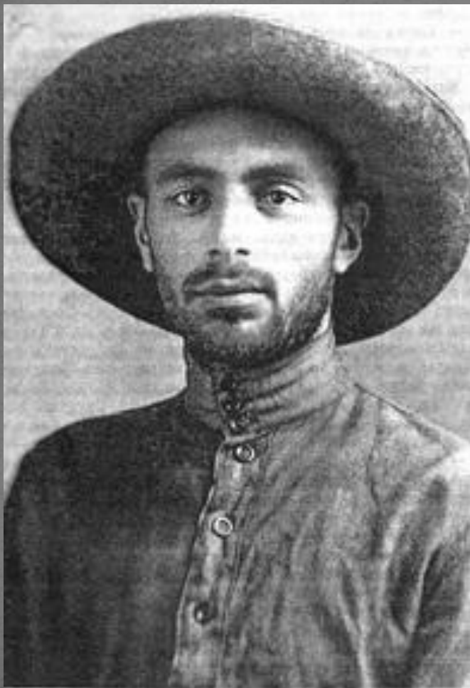
Куыдзæг 1934 азы.