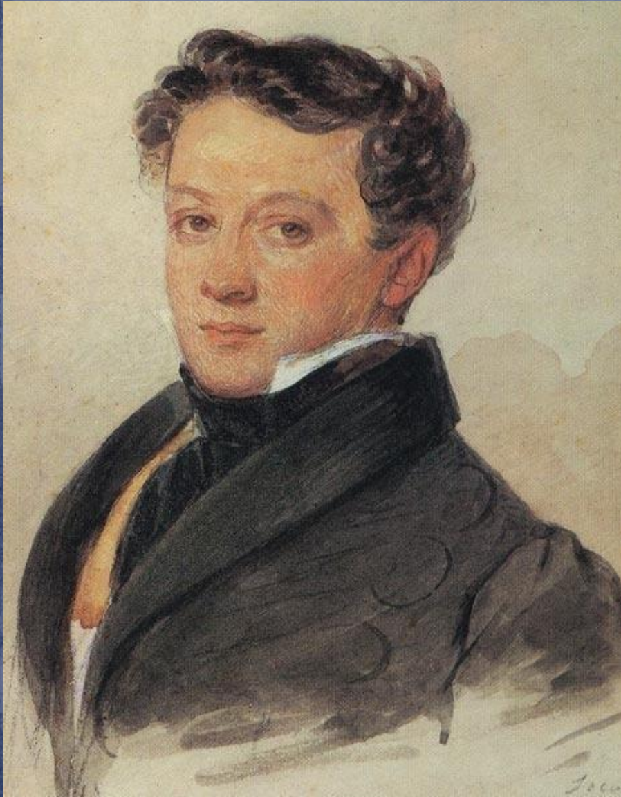
Иван Сергеевич Тургенев