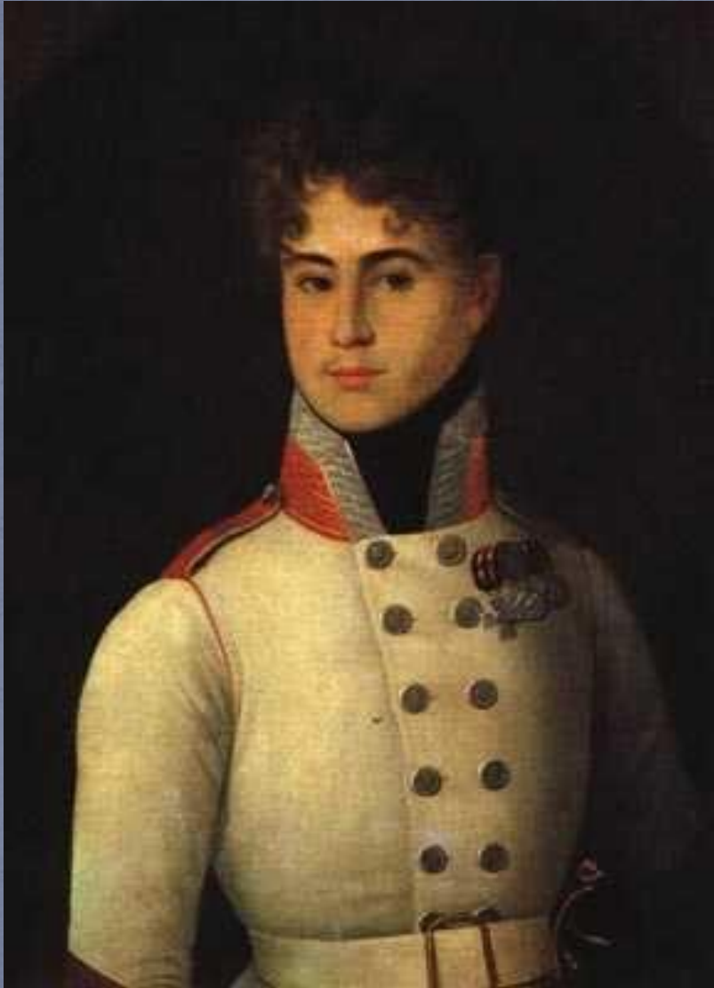
Отец Тургенева - Сергей Николаевич