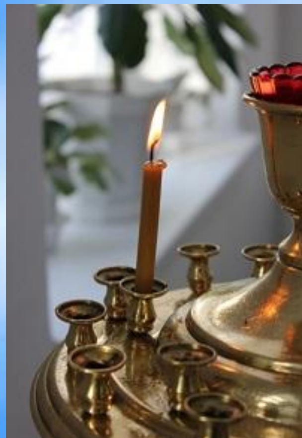
Царские врата, иконы, подсвечники, свечи в храме Великомученика и Целителя Пантелеймона