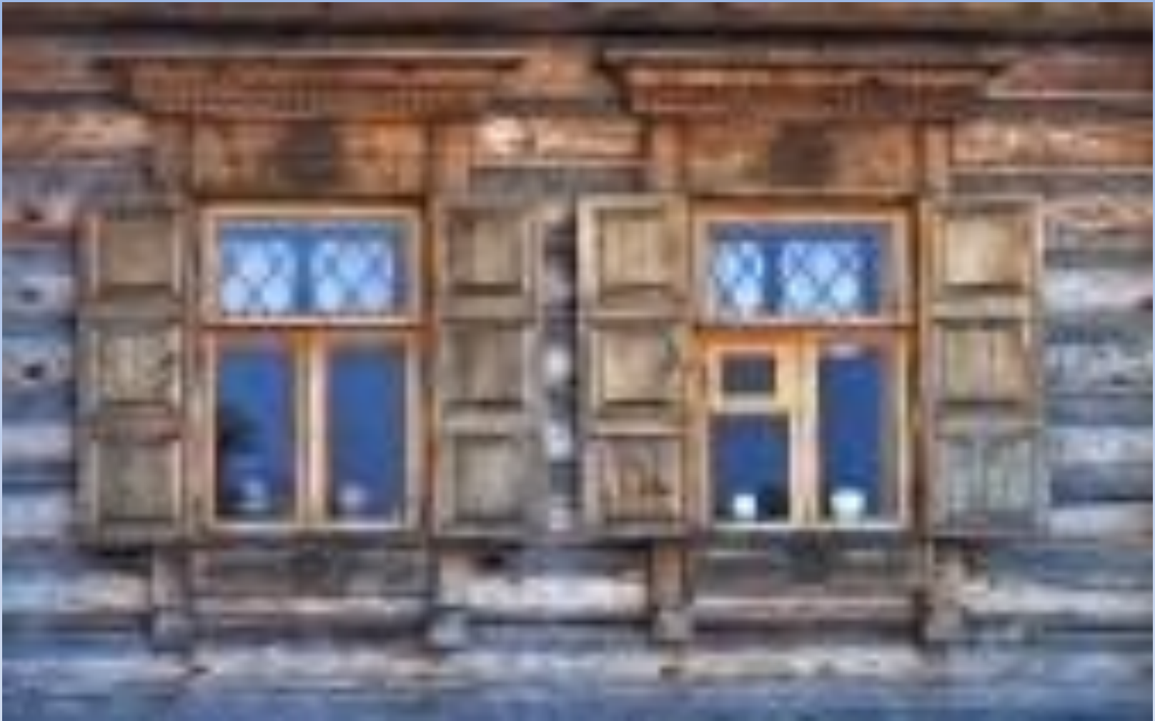
ДОМ СО СТАВНЯМИ