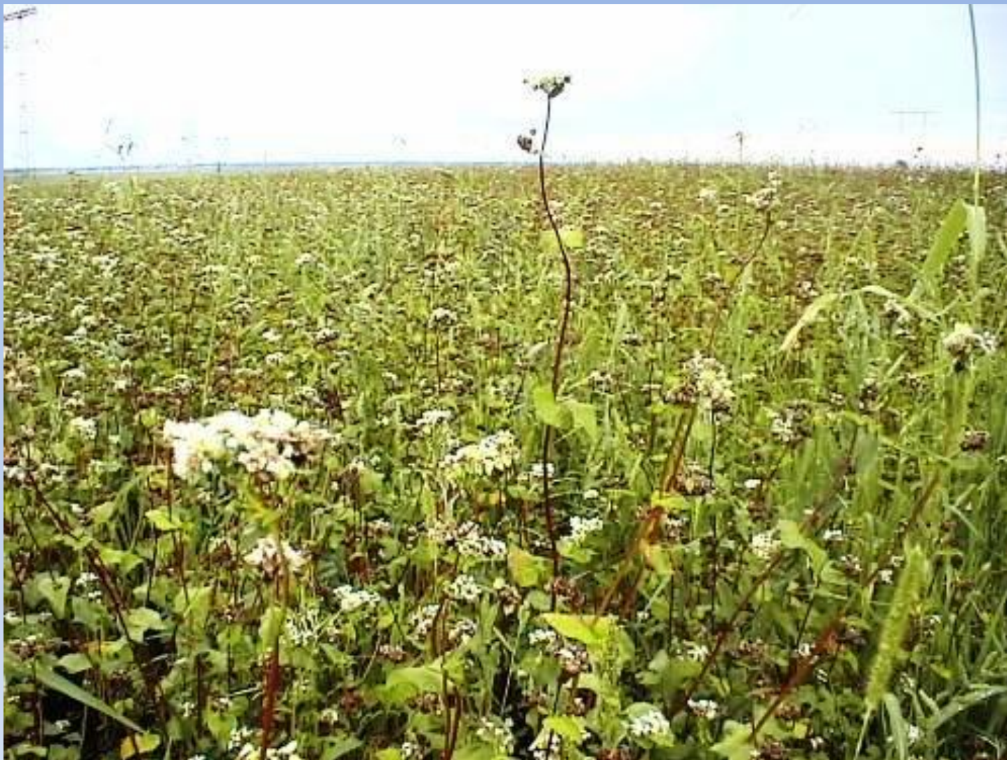
«поле с гречихой»