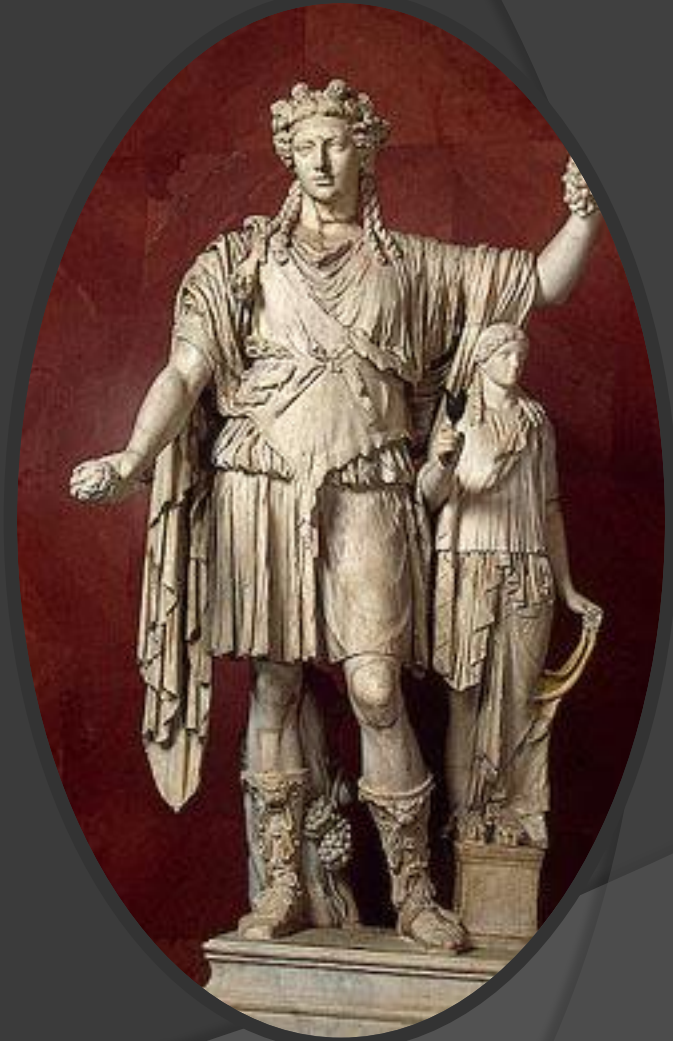
Скульптура бога Диониса

Вскоре праздники были перенесены в специальные места - театры , а спустя некоторое время появились драматурги - люди сочинявшие пьесы для театра.