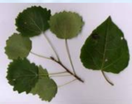
Осина – тополь дрожащий