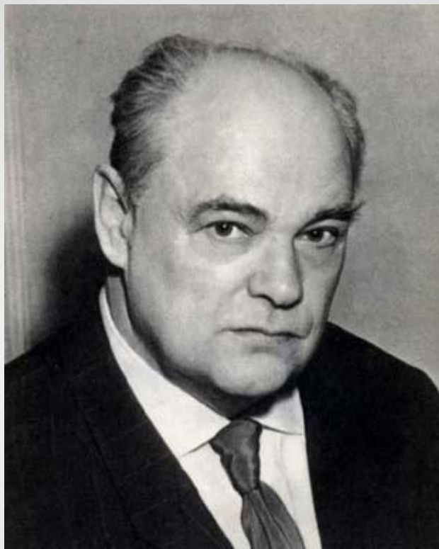
ЕВГЕНИЙ ИВАНОВИЧ ЧАРУШИН (1901 – 1965)