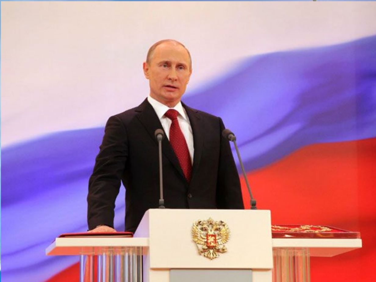
Президент Российской Федерации - Путин Владимир Владимирович