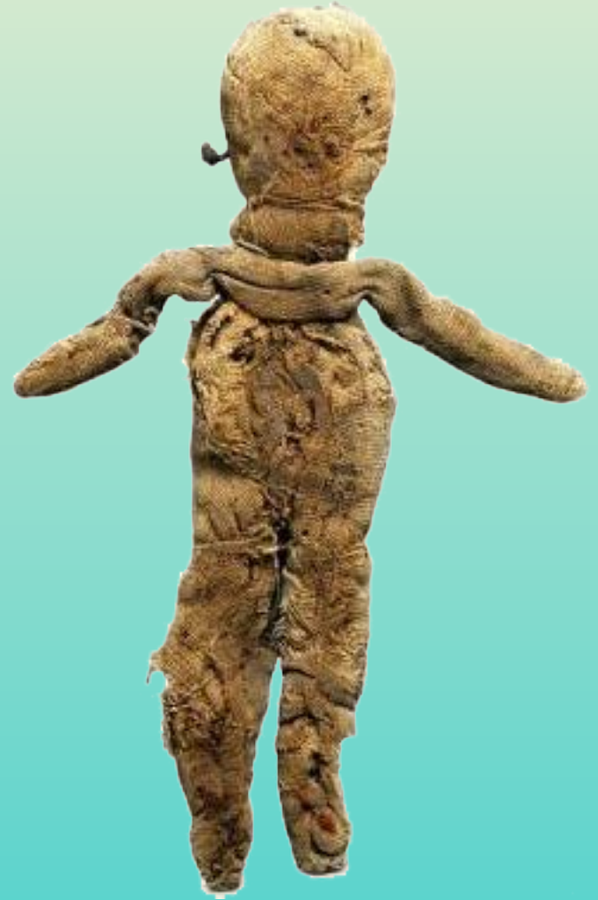
Тряпичная кукла, Древний Рим (4-3 вв. до н.э.)

Самая древняя кукла, найденная археологами при раскопках, была возраста 30-35 тыс. лет. Она сделана с подвижными конечностями и выполнена из мамонтовой кости.