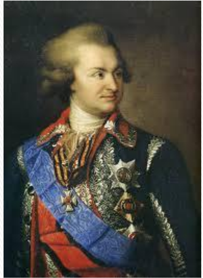
Князь Г. А. Потемкин

С этого времени возрастает приток населения на полуостров Крым, растут города, развивается торговля, сельское хозяйство. На берегу превосходной природной гавани в 1783 г. закладывается город Севастополь как база Черноморского флота. 21 февраля 1784 года Екатерина II издает именной указ князю Г. А. Потемкину строить «Крепость большую Севастополь, где ныне Ахтияр и где должны быть Адмиралтейство, верфь для первого ранга кораблей, порт и военное селение».