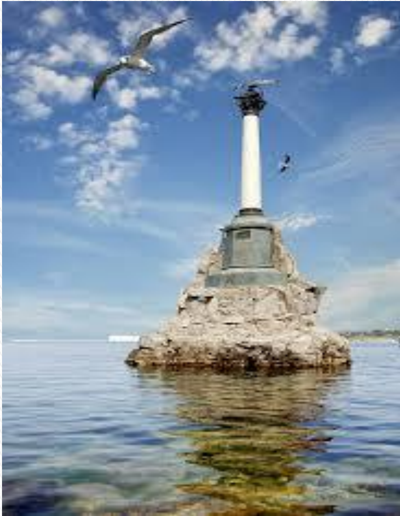
памятник затопленным кораблям в Севастополе