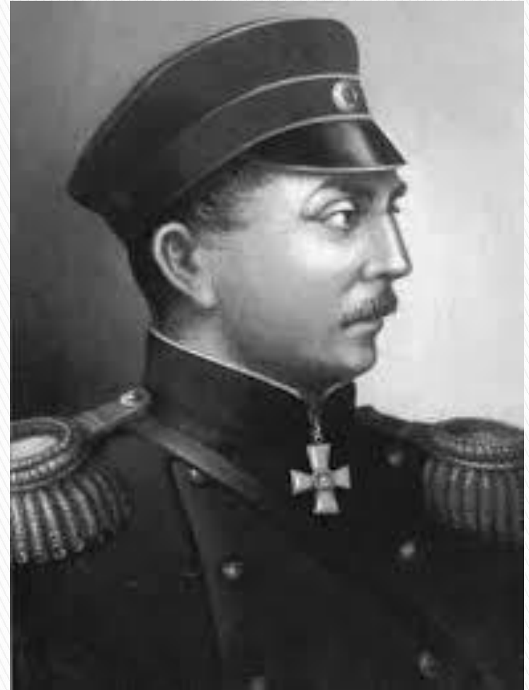
Адмирал П.С. Нахимов