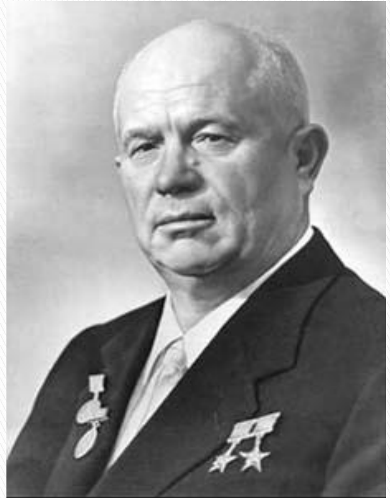
Хрущев Н. С.