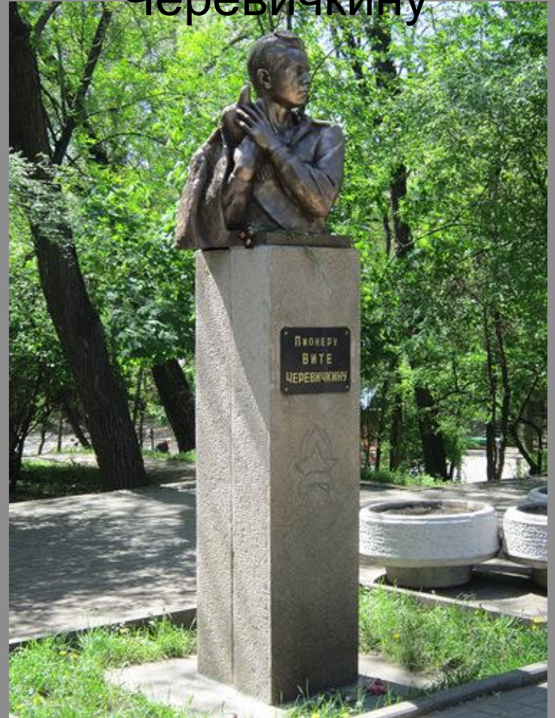
Памятник Вите Черевичкину