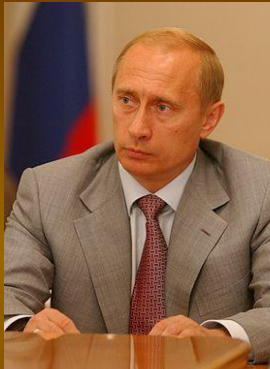
Владимир Владимирович Путин

Избирался Президентом два раза (12 июня 1991 – 31 декабря 1999 г)