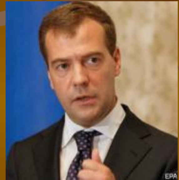
Медведев Дмитрий Анатольевич

Третий Президент Российской Федерации (2 марта 2008 по н. время)