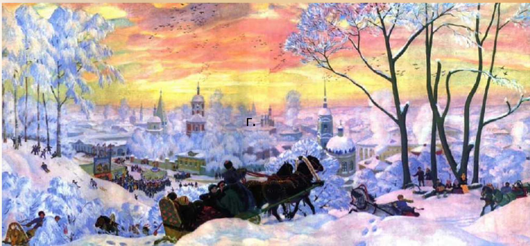
Б.М.Кустодиев. Масленица. 1916