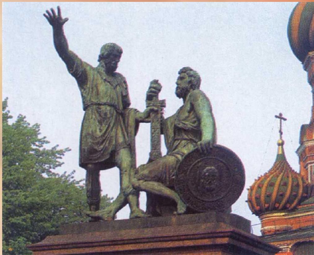
Памятник К.Минину и Д.Пожарскому в Москве. Скульптор Мартос И.П. 1804-1818 гг.

В доспехи веры грудь одень, И с богом, исполин державный!.. О Русь, велик грядущий день, Вселенский день и православный! Ноябрь 1849 г.