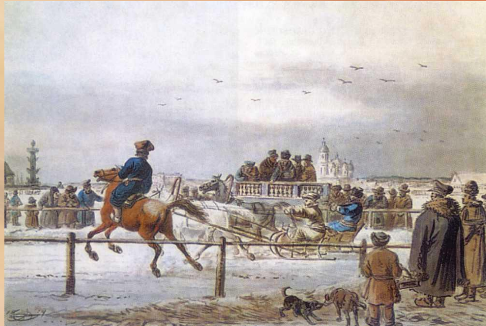
Орловский А.О. Бега на Неве 1814 г.