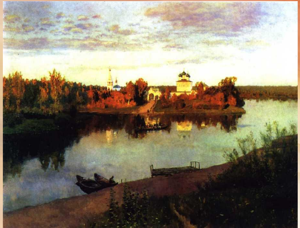
И.И.Левитан. Вечерний звон. 1892 г.