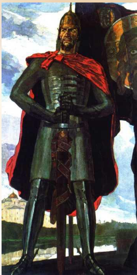
П.Д.Корин. Александр Невский. 1942 г.