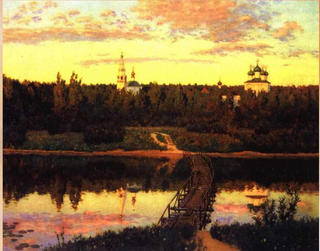
И.И.Левитан. Тихая обитель. 1890 г.