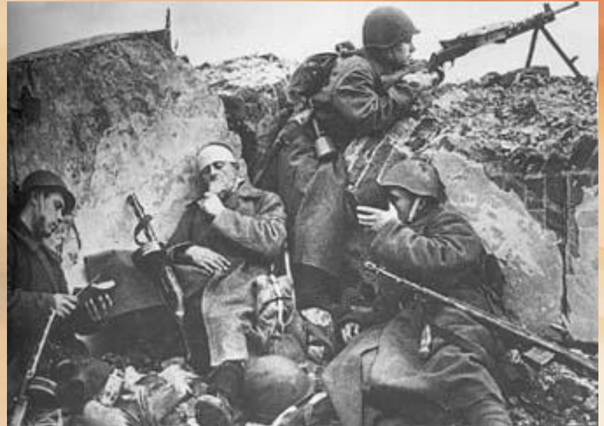
Фотография времен Великой Отечественной войны

Не сраженная бледным страхом И отмщенья зная срок, Опустивши глаза сухие, И сжимая уста, Россия От того, что сделалось прахом, В это время шла на Восток. И себе же самой навстречу, Непреклонно в грозную сечу, Как из зеркала наяву, Ураганом с Урала, с Алтая Долгу верная Молодая Шла Россия спасать Москву