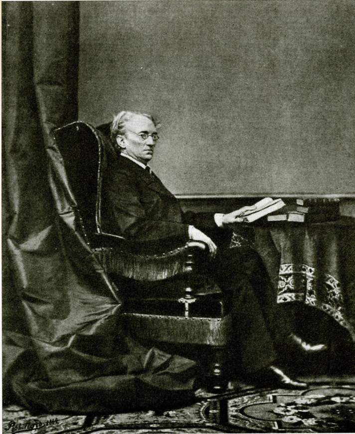
Ф.И. ТЮТЧЕВ 1862 г.