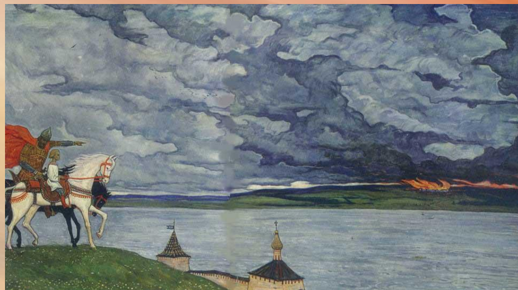
И.Глазунов. Два князя. 1974 г.

О, стонать тебе, земля родная, Прожные годыны вспомяна И князей давно минувших лет! Старого Владимира уж нет. Был он храбр, и никакая сила К Киеву б его не пригвоздила. Кто же стяги древние хранит? Эти — Рюрик носит, те — Давыд, Но не вместе их знамена плещут, Врозь поют их копия и блещут. (пер. Н.Заболоцкого)