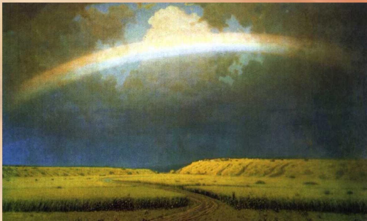
А.И.Куинджи. Радуга. 1900-1905 гг.