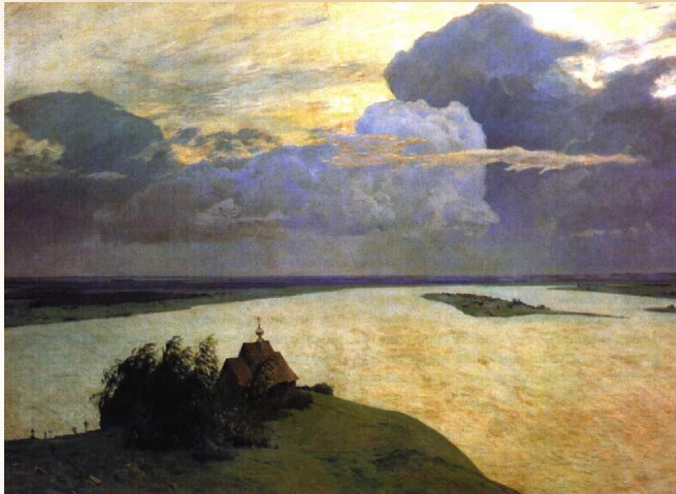
И.И.Левитан. Над вечным покоем. 1894 г.

Умом Россию не понять, Аршином общим не измерить: У ней особенная статья – В Россию можно только верить.