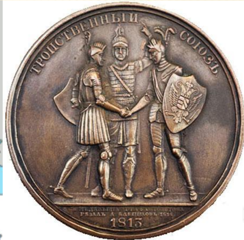
Медаль «Тройственный союз»