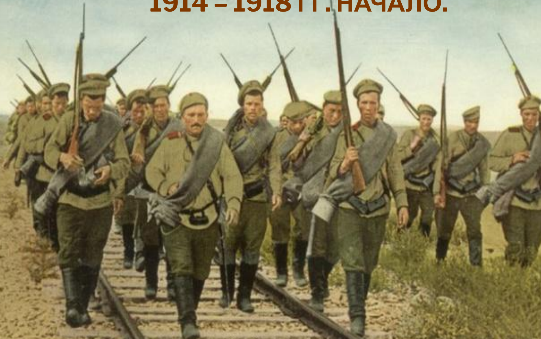
RUSSIAN REGULARS ON THE MARCH THROUGH GALICIA