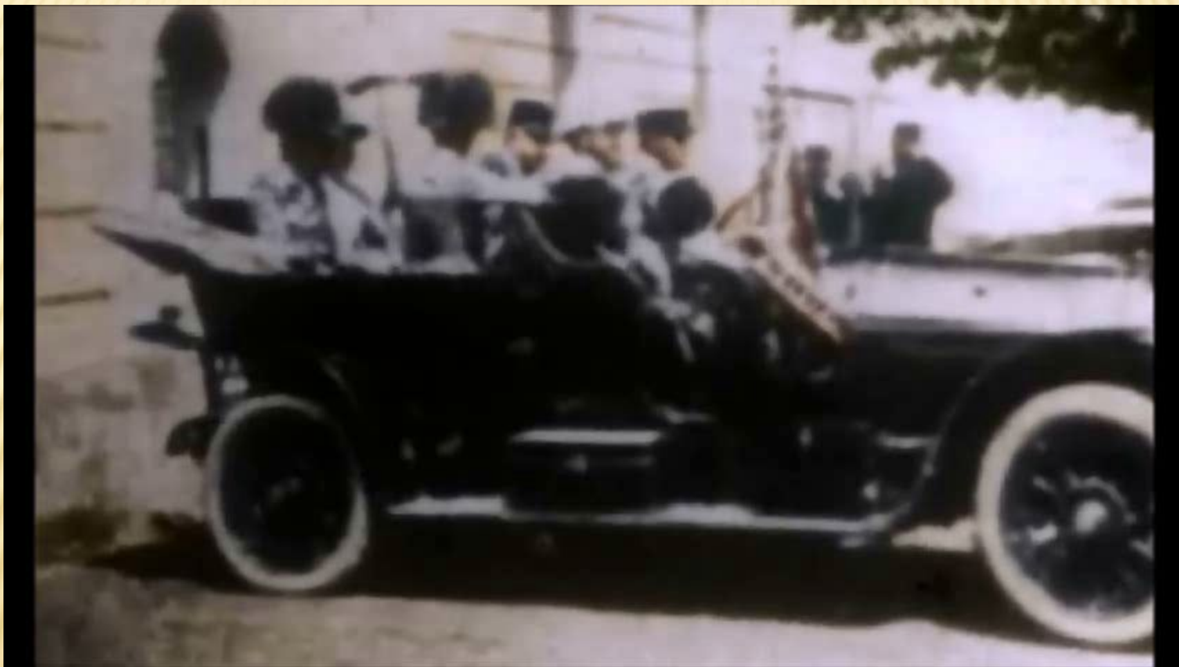
Видеофрагмент из фильма. «Первая Мировая война в цвете» (2003 г)