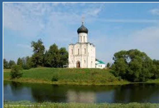
Церковь Покрова на Нерли