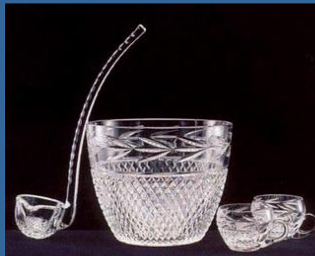
Хрусталь из г. Гусь - Хрустальный