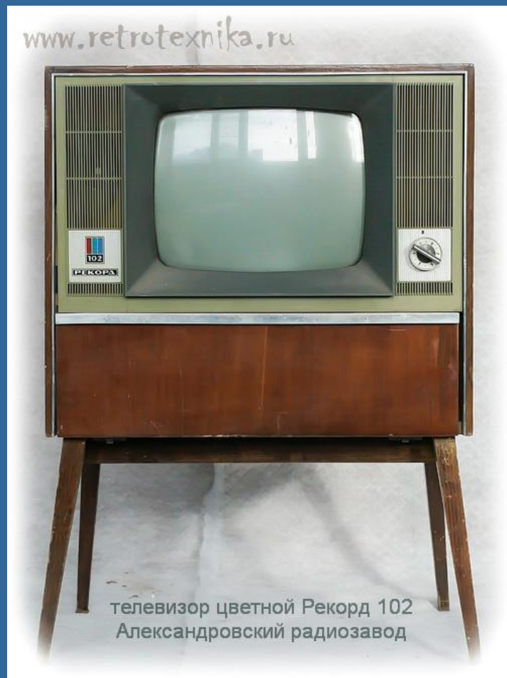
Телевизор «Рекорд» г. Александров