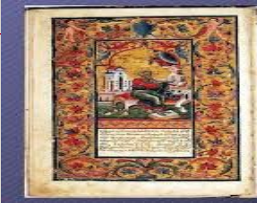
Мініатюра «Євангеліст Матвій», Переропівське євангеліє (1556 р.)