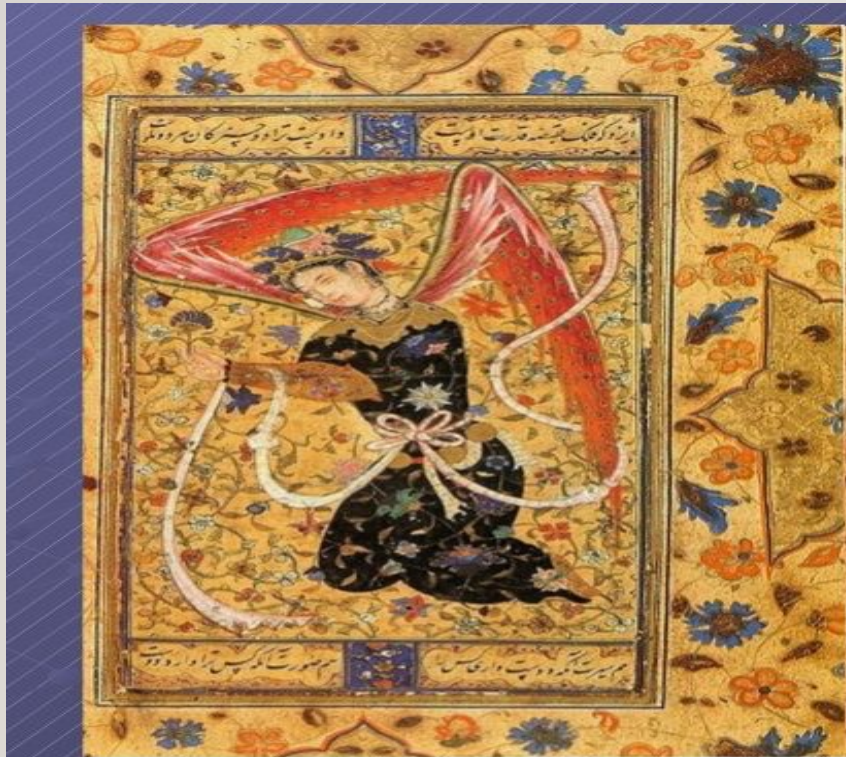
Янгол. Мініатюра з Персії