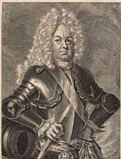
J. D. Bruce, Moscovitischer General Feldzeug- Meister, Ritter der Orden von S. Andrea 1726/7 und Weissen Adler.