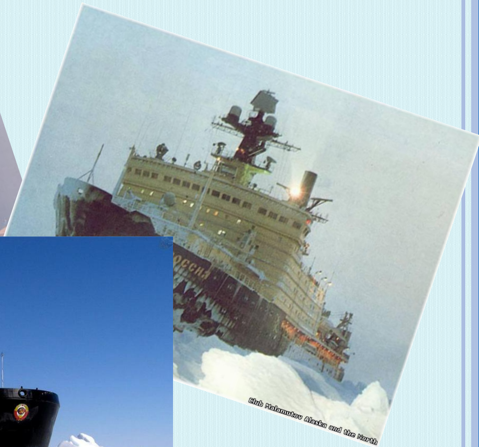
Club Malamutov Alaska and the North