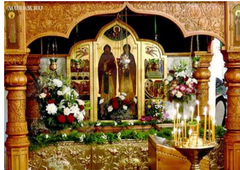
Рака с мощами святых под высокой иконой в золочёном окладе.

- Погребены были святые супруги в соборной церкви города Муром в честь Рождества Пресвятой Богородицы, возведённой над их мощами по обету Иваном Грозным в 1553 году, ныне открыто почивают в храме Святой Троицы Свято-Троицкого монастыря в Муроме.