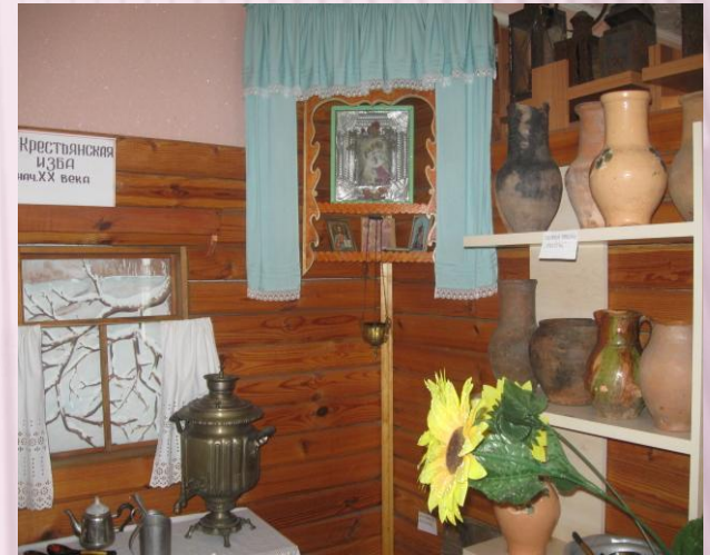
Святой угол в избе