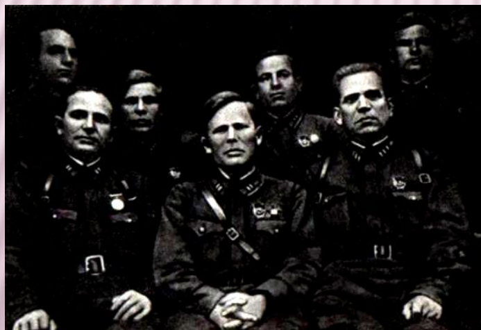
Командование Воронежского полка