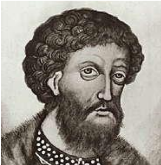
князь Ярослав Всеволодович

Родился в семье князя Ярослава Всеволодовича и княгини Феодосии, дочери князя Мстислава Удатного (Удалого).