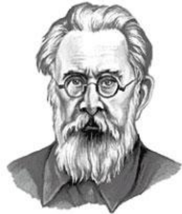
В. И. Вернадский (1863-1945)

Выдающийся русский ученый Академик, основоположник науки геохимии Создал учение о биосфере Земли.