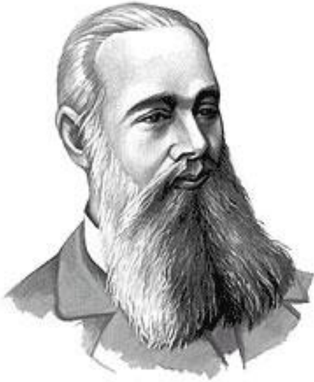
В. В. Докучаев