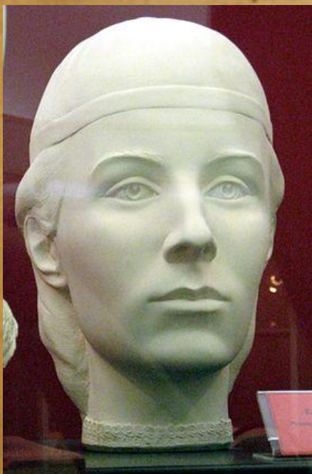
Елена Глинская Реконструкция по черепу, С. Никитин, 1999 г.

Годы жизни: около 1508 – 4 апреля (13 апреля) 1538