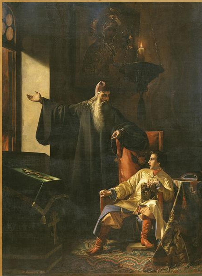
Иван IV и протопоп Сильвестр во время большого московского пожара 24 июня 1547 года (Павел Плешанов, 1856 год)

В том же, 1547 году, в Москве занялся сильнейший пожар. Свыше 1700 обгорелых трупов было найдено в городе (жителей было около 100 тыс.), и по Москве поползли слухи, будто город спалили колдовством, а виной всему — Глинские.