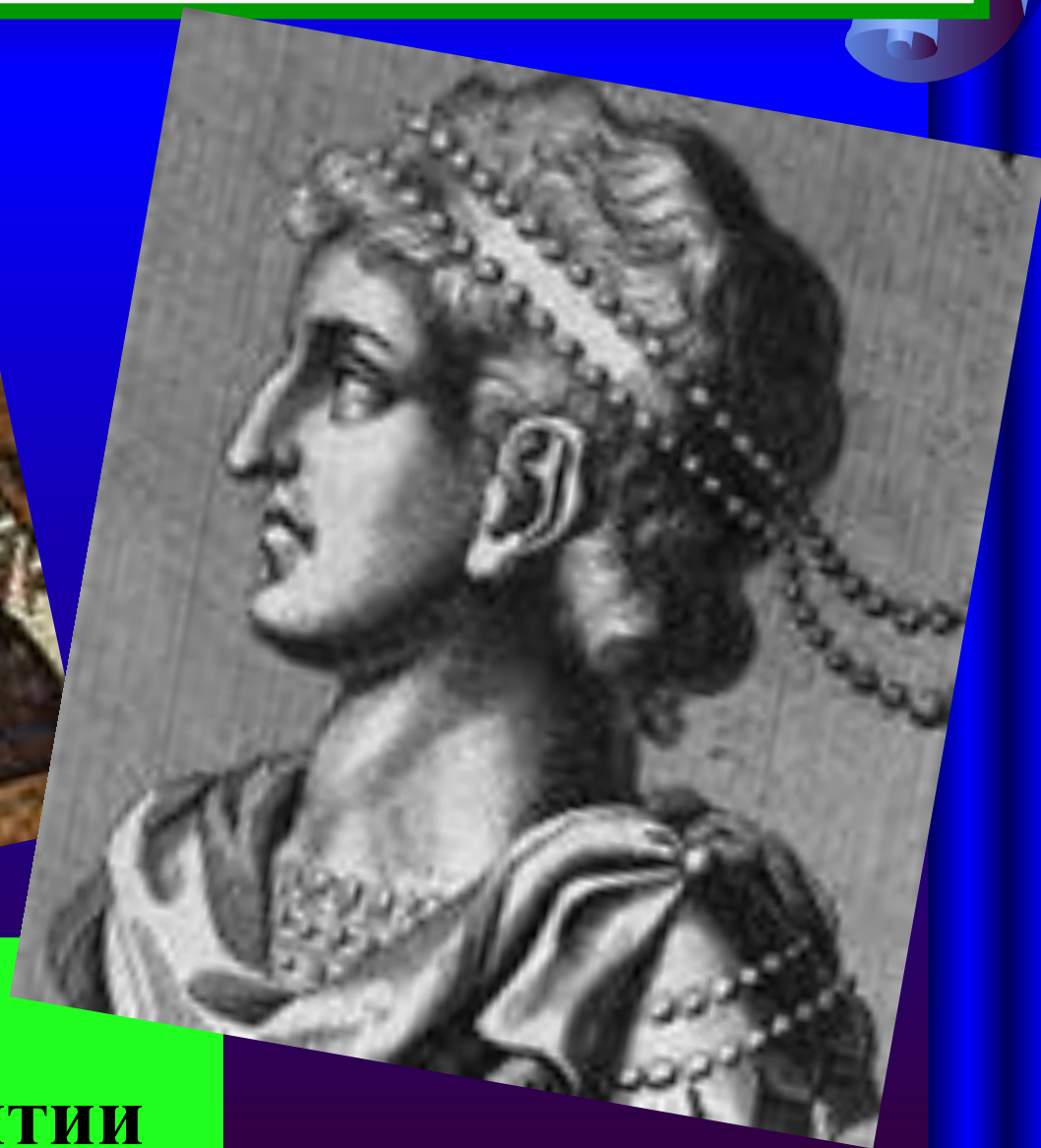
Юстиниан, Император Византии