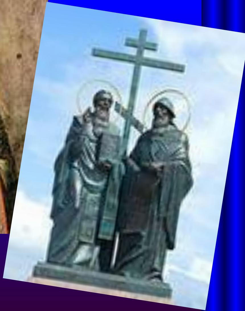
Кирилл и Мефодий