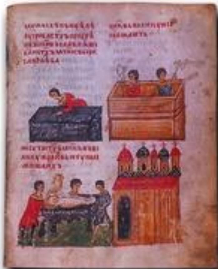
Исцеление слепого у гробницы св. князей. Строительство собора во имя святых Бориса и Глеба (вверху). Мощи св. князей переносят в храм.