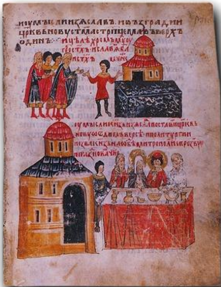
Исцеление хромого у гроба святых Бориса и Глеба (вверху). Трапеза у кн. Изяслава по случаю сооружения новой церкви во имя св. князей-страстотерпцев.