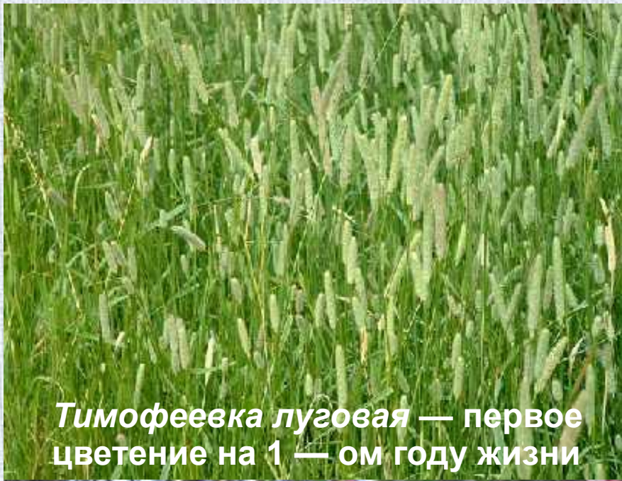
Тимофеевка луговая — первое цветение на 1 — ом году жизни