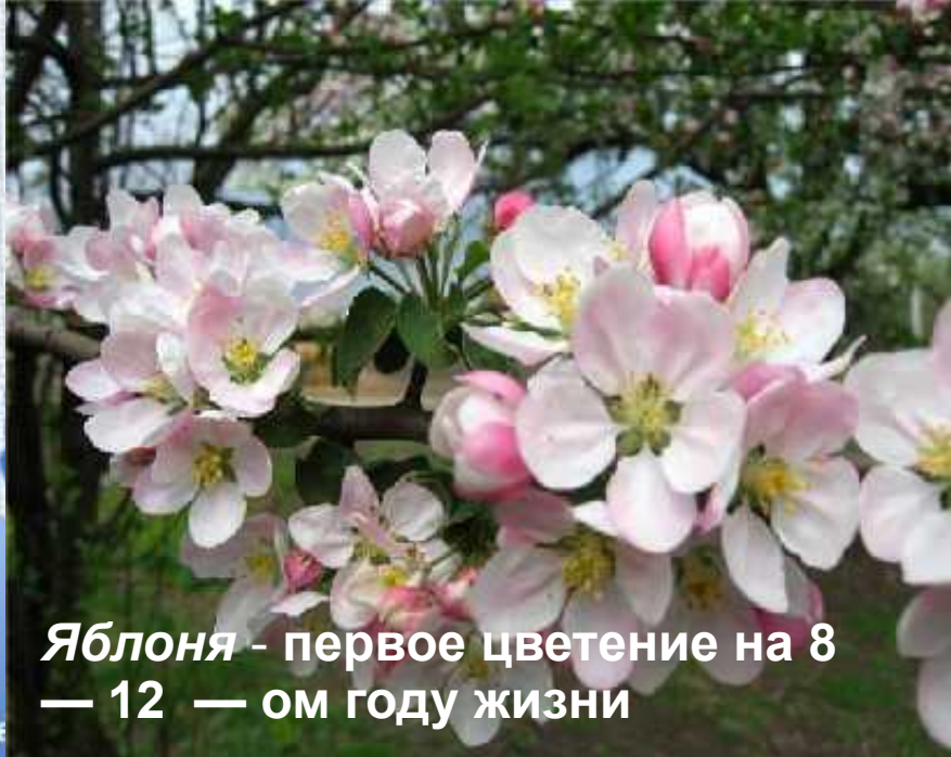
Яблоня - первое цветение на 8 — 12 — ом году жизни