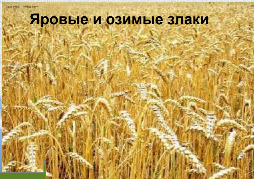
Яровые и озимые злаки

К таким видам относятся однолетние растения, многие двулетние, из многолетних - некоторые виды бамбука, пальм, агавы.