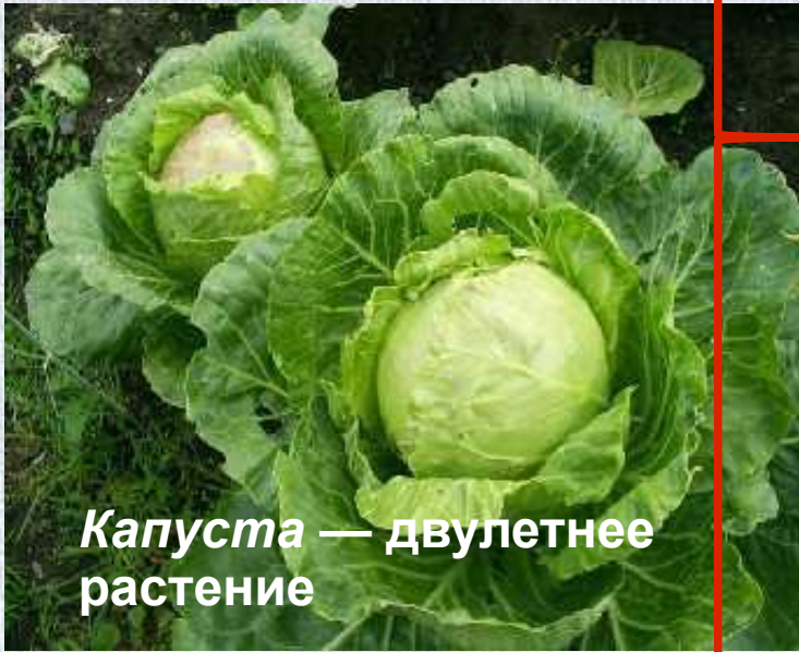
Капуста — двулетнее растение