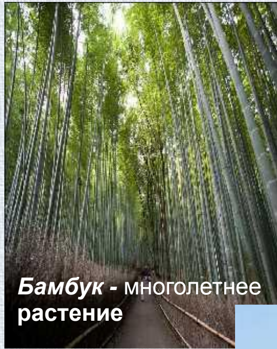
Бамбук - многолетнее растение