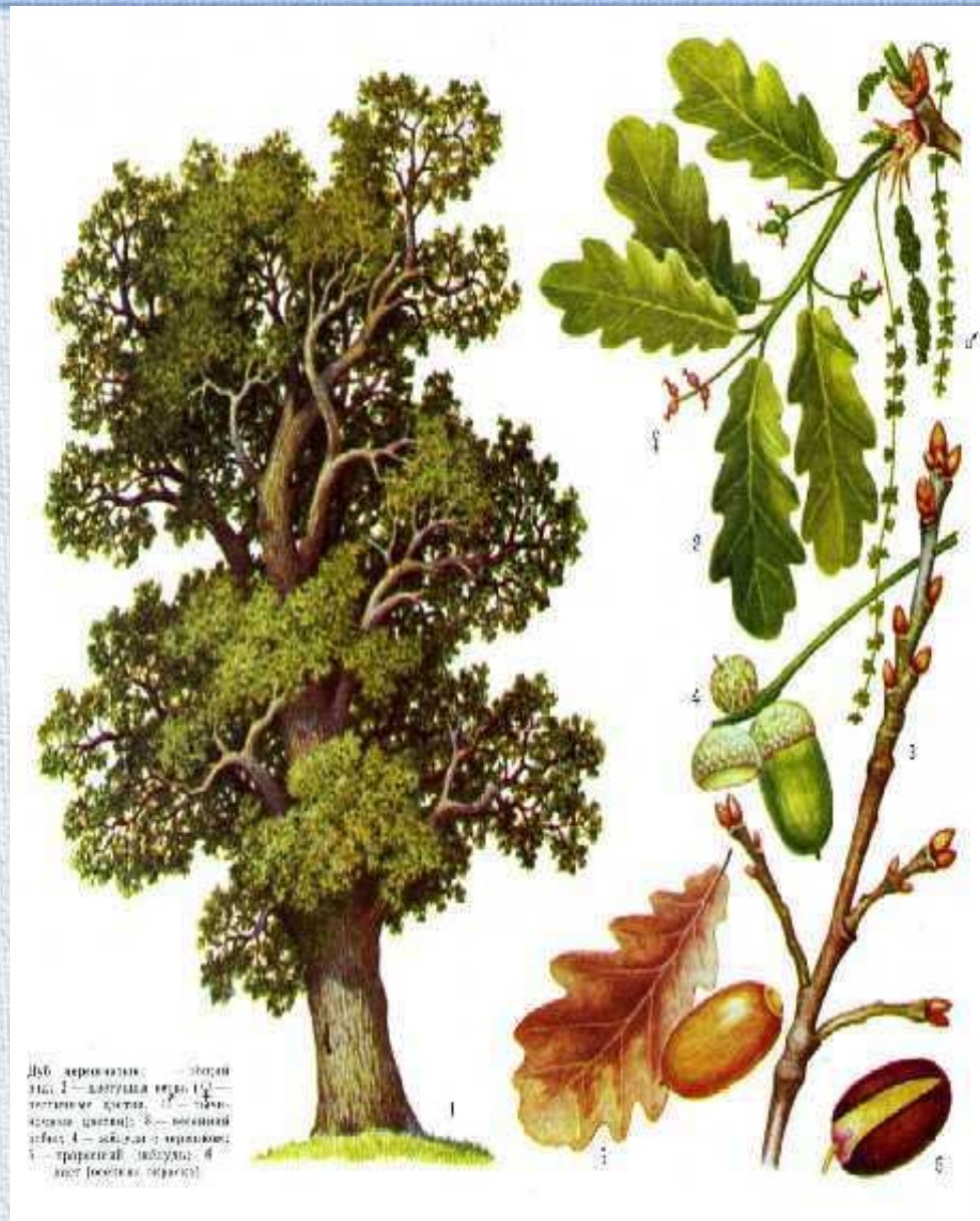
Дуб — первое цветение на 40 — 60 — ом году жизни