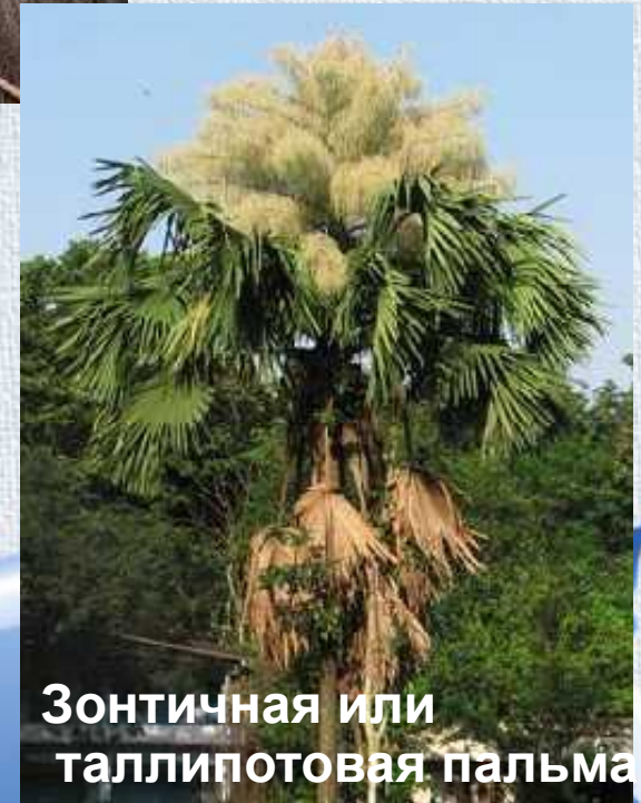
Зонтичная или таллипотовая пальма