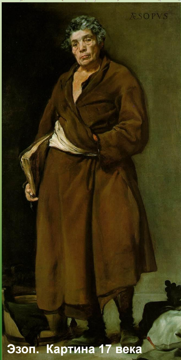
Эзоп. Картина 17 века