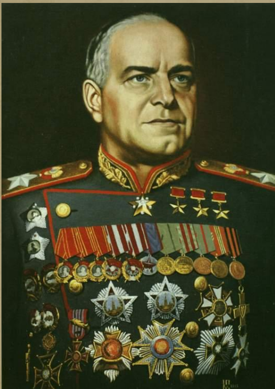
Георгий Константинович Жуков

Назовите четырежды Героя Советского Союза, в народе прозванного Маршалом Победы.