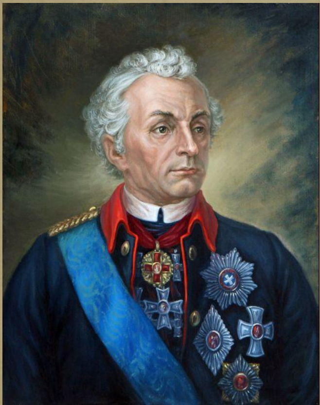
Александр Васильевич Суворов

Назовите русского полководца, который не проиграл ни одного сражения.