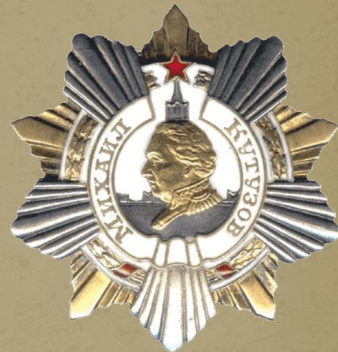
Орден Кутузова, им награждали вовремя Великой Отечественной войны