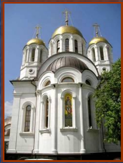
Кирилло- Методиевск ий собор в Самаре