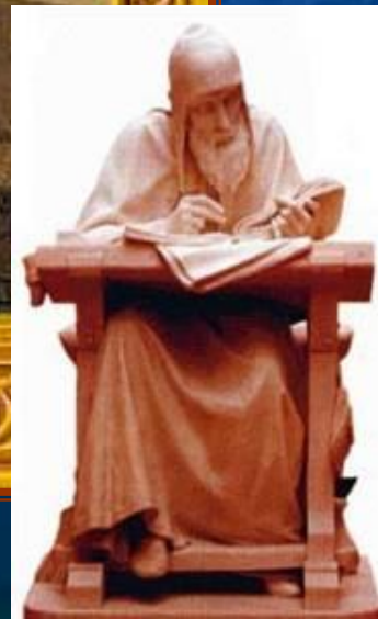
Летописец Нестр Васнецов