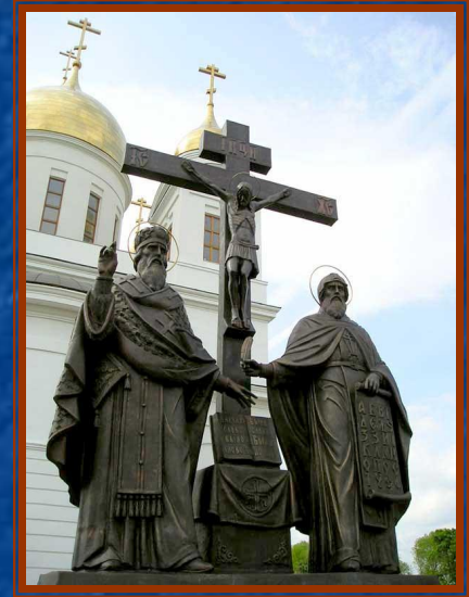
Памятник Кириллу и Методию в Самаре