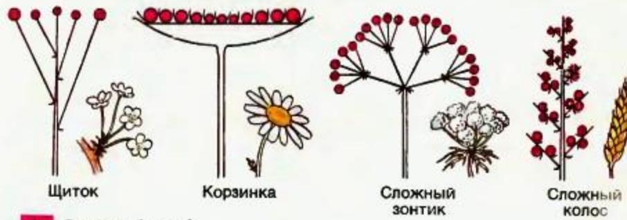
90 Соцветия (схема)