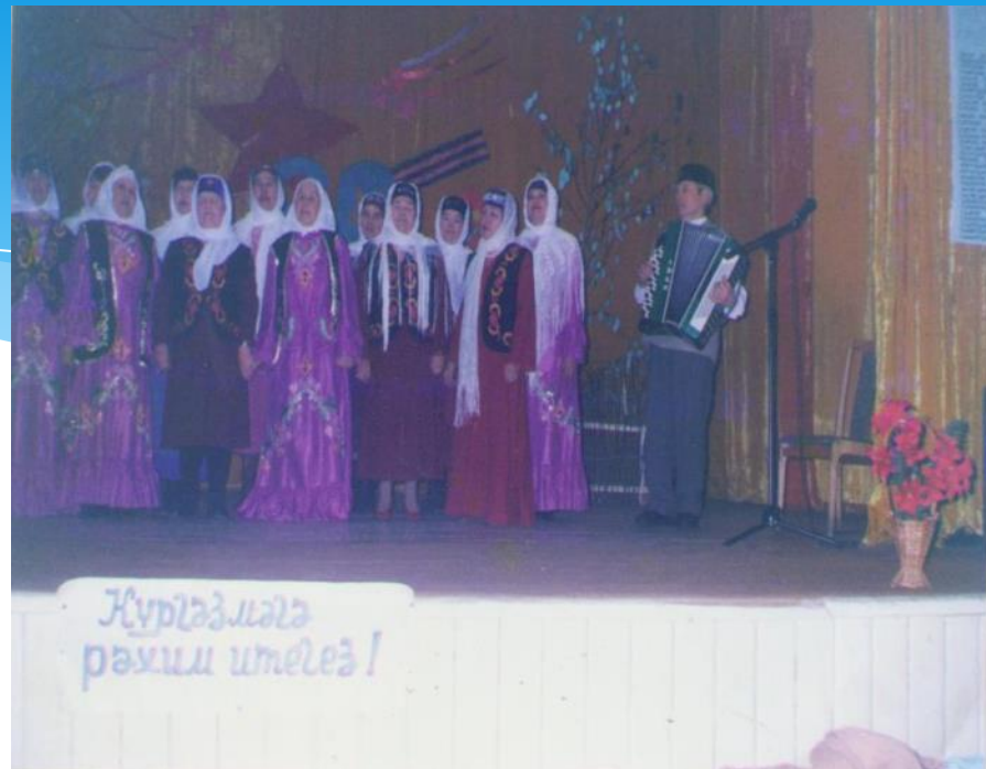
Изге Биләргә сәяхәт, 2008 ел