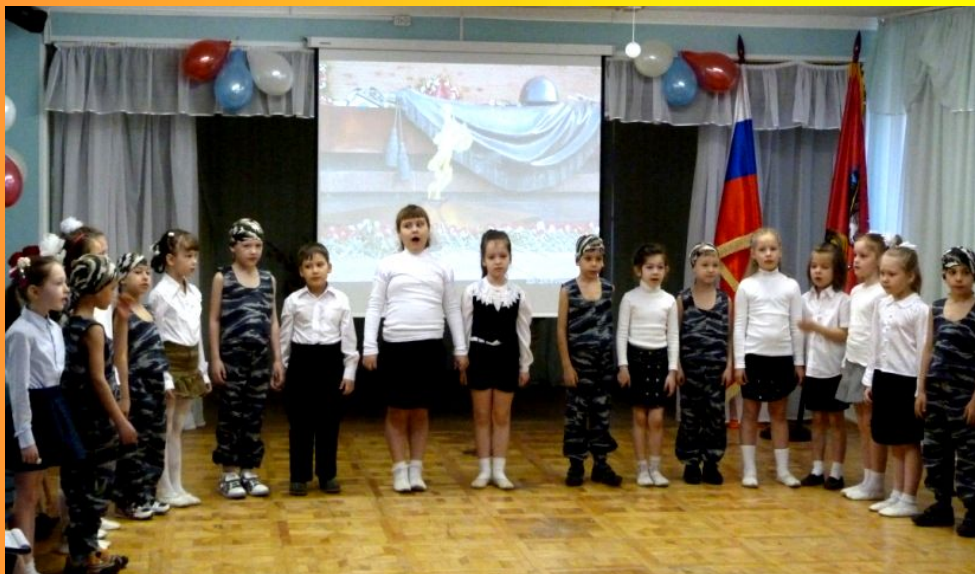
День защитника Отечества