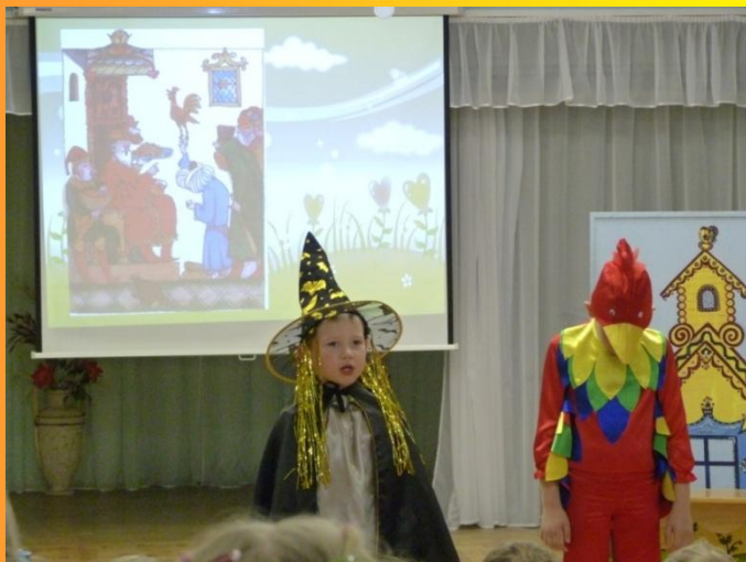
День рождения А.С.Пушкина