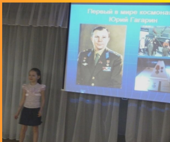
«Музей глазами детей»