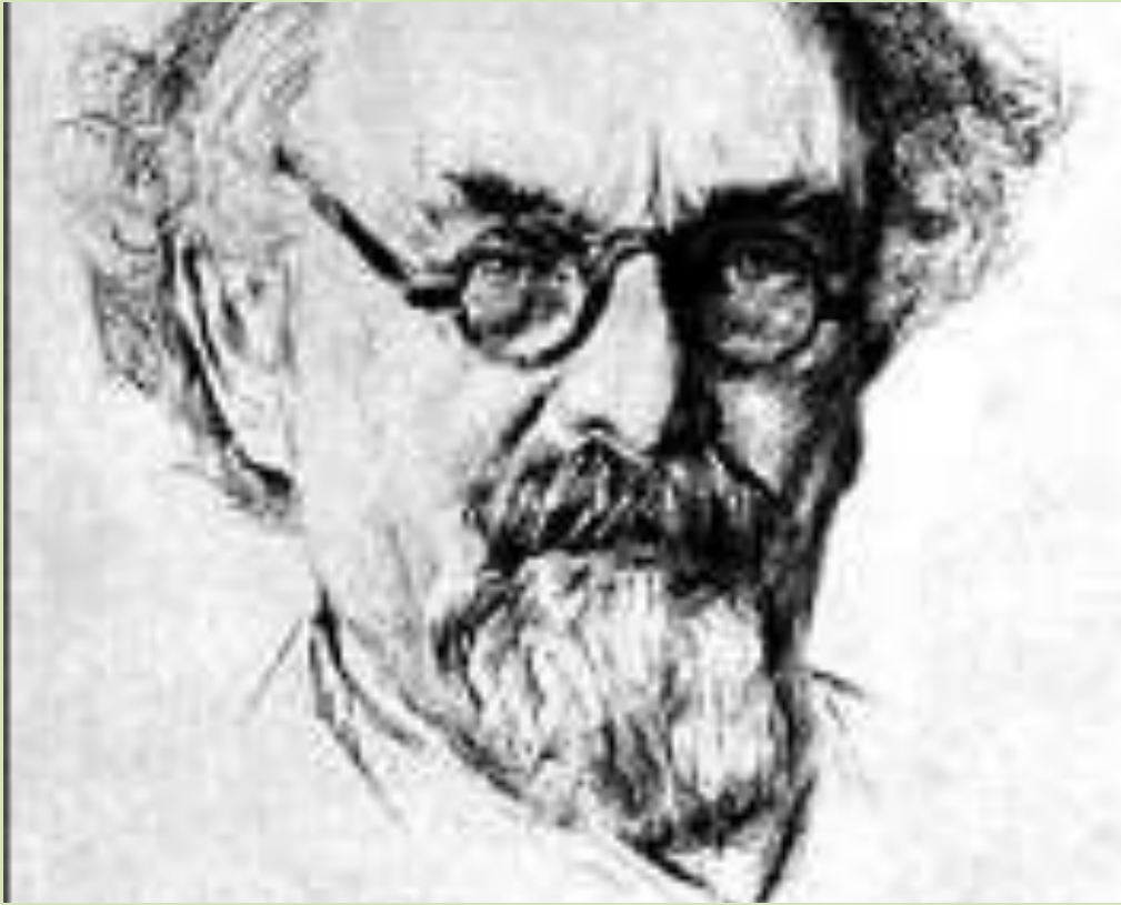
Михаил Иванович Пришвин