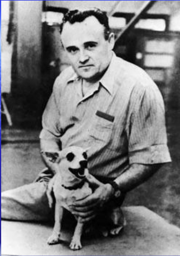
Сергей Павлович Королев