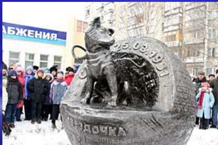
Памятник Звездочке в Ижевске