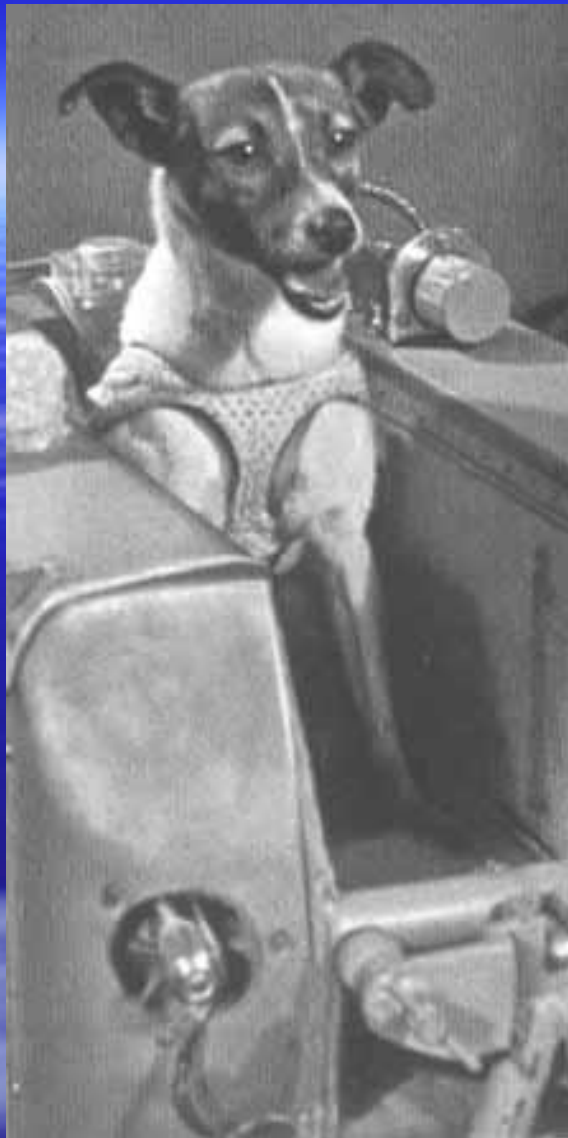
Биокосмонавт Лайка перед полетом в космос