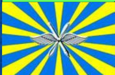
Флаг Военно- воздушных Сил Российской Федерации