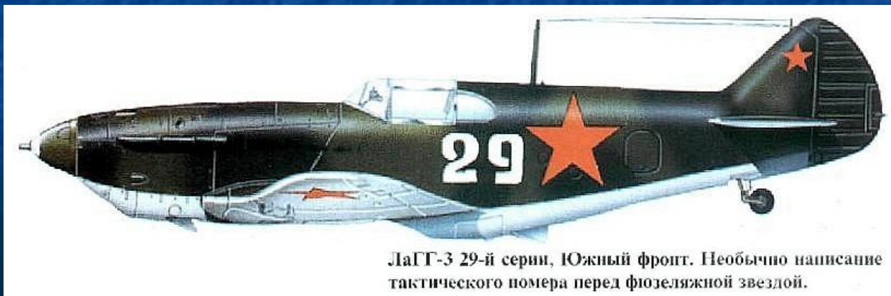
ЛаГГ-3 29-й серии, Южный фронт. Необычно написание тактического номера перед фюзеляжной звездой.