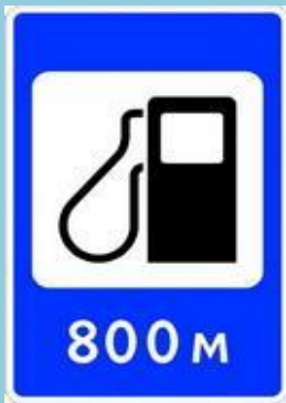
авто заправочная станция

А ещё есть знаки- добрые друзья: Укажут направление вашего движения, Где поесть, заправиться, поспать, И как в деревню к бабушке попасть.