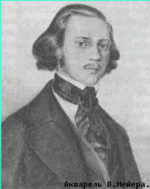
Акварель В. Мейера.